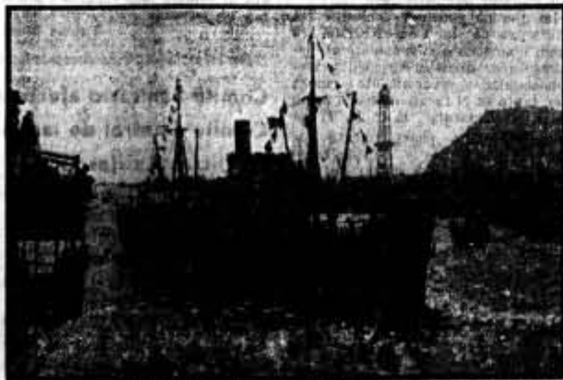
Un momento del arribo al fondeadero catalán.