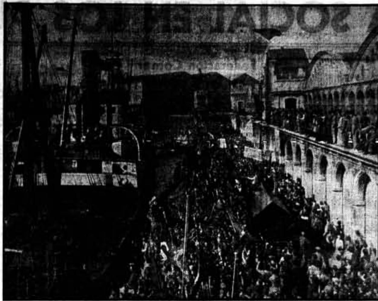
Grandiosa acogida al barco ruso, símbolo de solidaridad obrera

Se convoca a todos los afiliados a la C. N. T. y F. A. I., procedentes del país vasco, a una reunión que se celebrará hoy, jueves, a las seis de la tarde, en la Universidad Popular, calle Diputación, 231 (detrás de la Universidad de Cataluña), para un asunto muy importante.