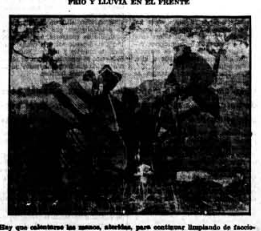
Hay que calentarse las manos, abriendo, para continuar limpiando de facciosos las aldeas de un pueblo recientemente tomado.