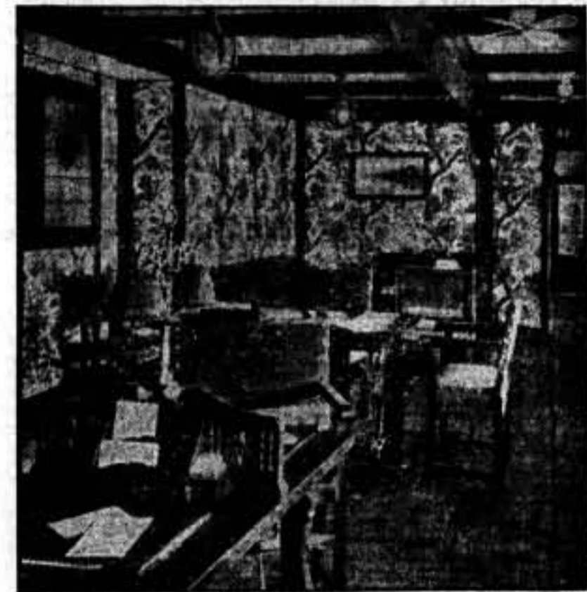
Salón de escritura de primera clase.