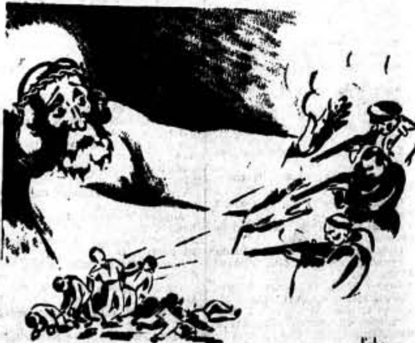
Cristo, impotente para detener a sus "discípulos". (Discípulos pindosos, caritativos, humanos...)