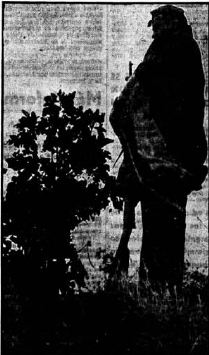
Aguantando, imperterritos, las inclemencias del tiempo, nuestros soldados no abandonan un momento la guardia que se les encomendó.