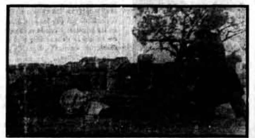
Entre un verdadero torrente y con una temperatura glacial, nuestras tropas terminan con los últimos reductos de un pueblecito reconquistado en el sector del Centro.