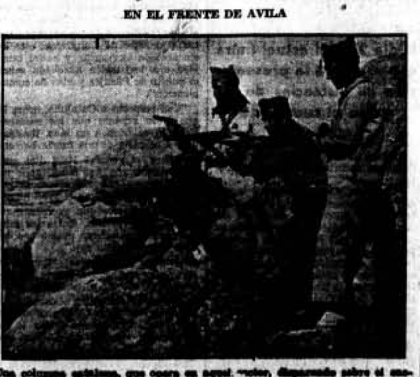
Una columna cubana, que opera en aquel sector, dispuesta sobre el enemigo, protegida por las patas de aquellas torres.

¡Viva la C. N. T. ! ¡Viva la F. A. I. ! Sindicato Unico de Campesinos de Barcelona y su Radio