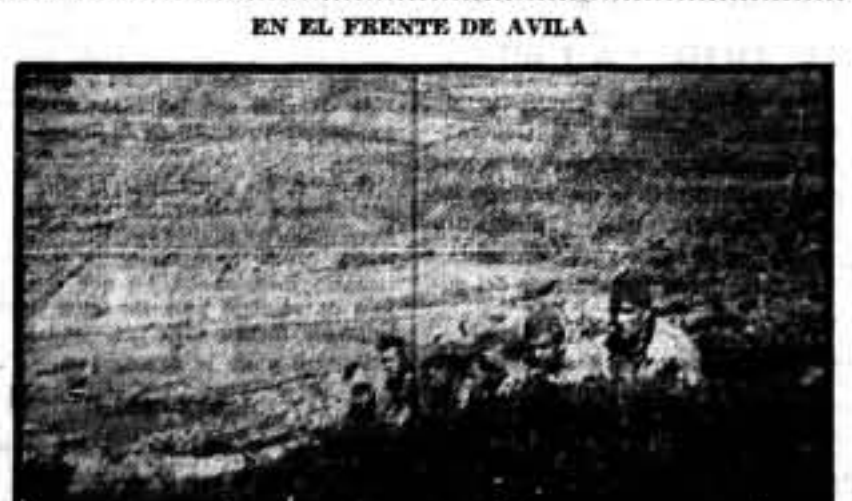
Los milicianos de la columna catalana que opera en aquel sector, protegidos por unos de los pocos maorreros que hay en aquellas tierras, vigilando al enemigo.