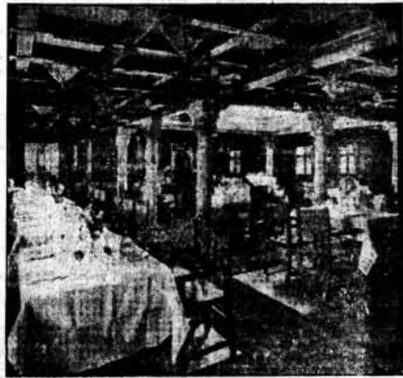
Salón comedor de primera clase.