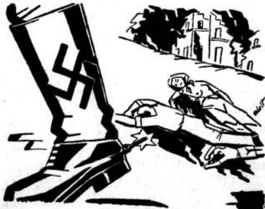
¡HAN PASADO LOS BARREROS!