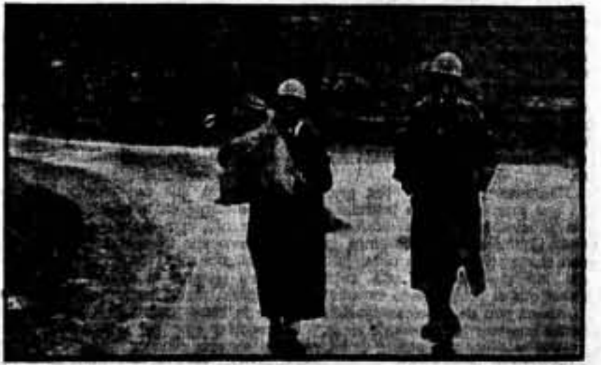
Estos milicianos, hacen el servicio de Correos por las carreteras y bajo la lluvia y el barro, pero saben que sus compañeros los aguardan para saber noticias de los suyos.