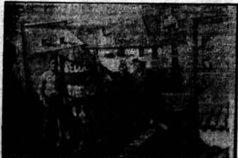
Los dinamiteros asturianos que actúan en aquel sector.