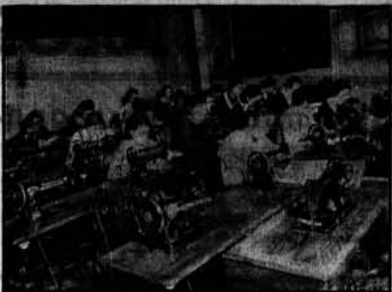
Vista parcial de la tienda de la calle de Aviñó, 9. — Restos juveniles de mujer, plantas de madres proletarias que acarician, con ilusión, la Wertheim construida bajo el signo de la C. N. T.

crimen que defraudáramos sus esperanzas. De estos talleres salen mensualmente trescientas cincuenta máquinas Wertheim con destino al despacho central de la calle Aviñó, 9, y a las ciento cincuenta sucursales que existen en Cataluña. Contra los que, con un espíritu de competencia mezquina, propalaban la falsedad de que la Wertheim era firma fascista, decimos muy alto que la Wertheim no