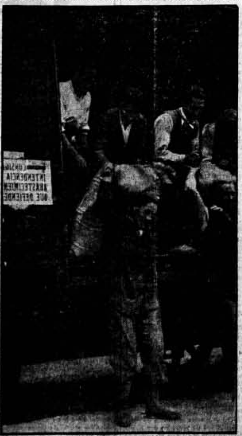
En las estaciones la gente que circula por sus alrededores es solicitada para que ayude a descargar los vagones de los trenes llegados con mercancías. La gente del pueblo se presta gustosamente a transformarse en descargadores. Unos cuantos compañeros entregados a dicha labor en uno de los trenes consignados a Intendencia para el abastecimiento de nuestra brava población militar.

El enemigo lucha a la desesperada al fracasarle sus objetivos, al observar cómo sus proyectos se quiebran. La desmoralización cunde en sus filas, y al fin, la derrota no se hará esperar. Redoblemos nuestros esfuerzos y que la ofensiva arreele en todos los frentes.