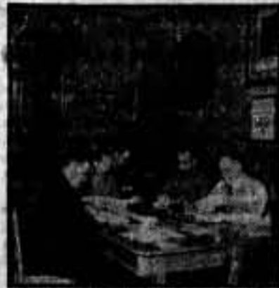
Compañeros que forman el Comité administrativo

Nuevo pabellón de montaje. Tenemos una serie de cabezas Wertheim a la vista; un operario de manos hábiles comprueba las máquinas antes de despacharlas con el "Visto Bueno".