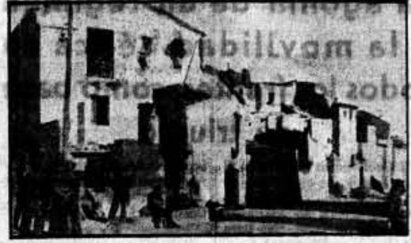
Esta foto representa la entrada del pueblo de Siétamo. Las casas que durante siglos albergaron la esclavitud de los campesinos, donde nacieron más de veinte generaciones de éstos, donde el cacique fué el amo y señor de viñas y haciendas; este pueblo de siglos ha desaparecido bajo la tos incombustible y las balas de cañón. Nada hay aprovechable: sólo queda la tierra, para que sobre ésta los obreros de la libertad edifiquen un pueblo moderno y luminoso, en que la fraternidad esté alumbrada por el sol de la verdad.