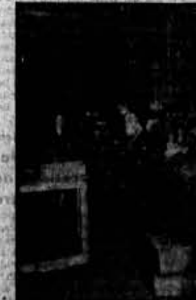
Tornearía. — Maquinaria perfecta que permite la perfección en el trabajo.

no", que será garantía de perfección y rapidez en los mercados.