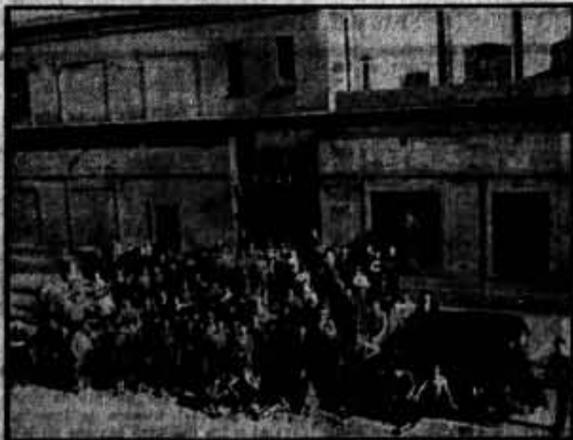
Los obreros de la Wertheim pesan, satisfechos, en las puertas de su fábrica.

En esta industria "Colectividad Obrera Wertheim Rápida, C. N. T.", trabajan trescientos compañeros confederados, con una fe enorme en su empresa. Nosotros debemos alentar sus aspiraciones de libertad; sería un