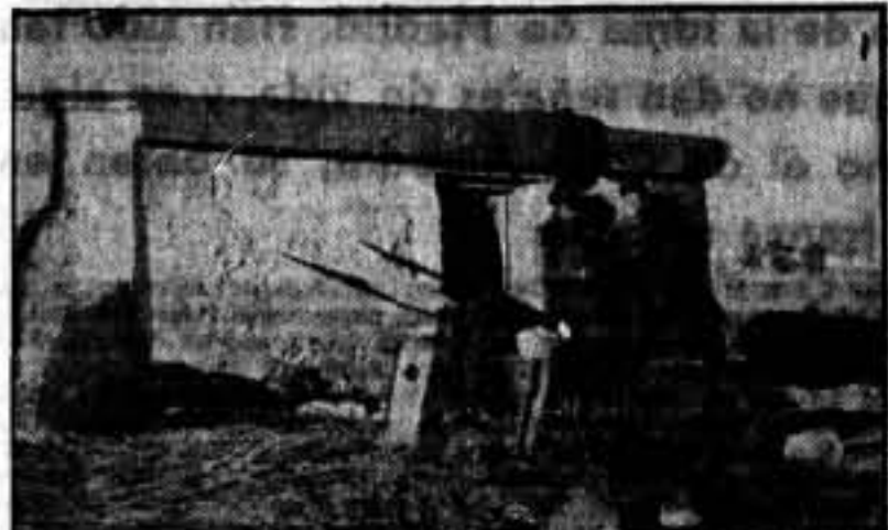
Esta careta de cemento, no es un refugio ni fortín. Socavada la tierra por los fascistas, en sus entrañas almacenaron artefactos de muerte. Nuestros aguiluchos, en la toma de Estrecho Quinto y Monte Aragón, fueron los primeros en tomar este potvorín y rebasario, en persecución de los cerdos fascistas. La muerte, convertida en pólvora y en trillita, se oculta bajo ese pequeño edificio, cuyo contenido sería suficiente para volar un pueblo y matar miles de seres.

Impacientes están Los Aguiluchos por entrar en Huesca. Su ansia por entrar es incontenible. ¿Qué les detiene? La obediencia al mando; Y luego dicen que los anarquistas no son disciplinados! Frente a Huesca, 19-10-36.