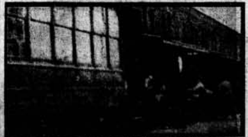
A las estaciones madrileñas ha llegado el primer cargamento de productos alimenticios, enviados por el pueblo ruso a sus hermanos de España. Las mercancías son transportadas en tranvías a los distintos centros de distribución. Aquí vemos un tranvía, con su correspondiente remolque, que son cargados de galletas trasladadas de un buque ruso llegado momentos antes.