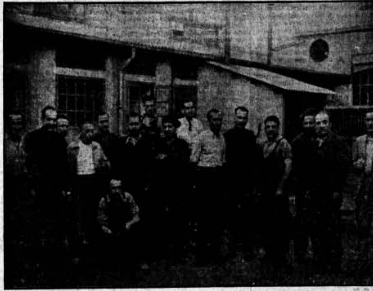
El Comité de fábrica que reemplaza, con tanto acierto, la dirección técnica de sus ex ingenieros, con algunos compañeros de trabajo

Wertheim, hoy, es una buena, una excelente máquina de coser. Por esto la Wertheim era nuestra, porque produciéndola y perfeccionándola nos hemos pasado, podemos decir con razón, nuestra vida.