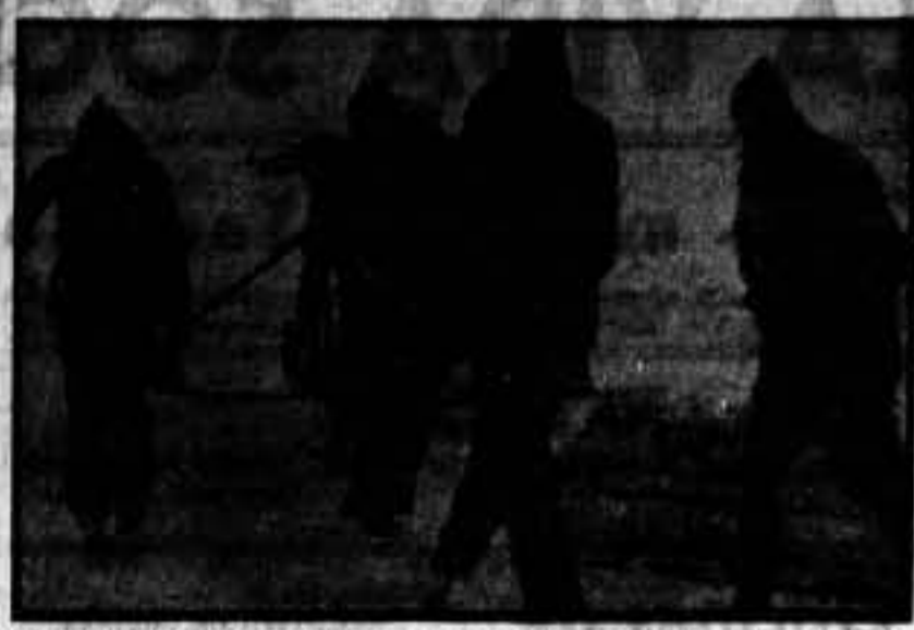
Frio muy intenso. Y a través de las nieblas, nuestros heroicos milicianos cambian de emplazamiento una ametralladora.

LOS DOS SELLOS DEL GRUPO INTERNACIONAL —COLUMNA DURRUTI— QUEDAN ANULADOS. EL DELEGADO, GIRARDIN