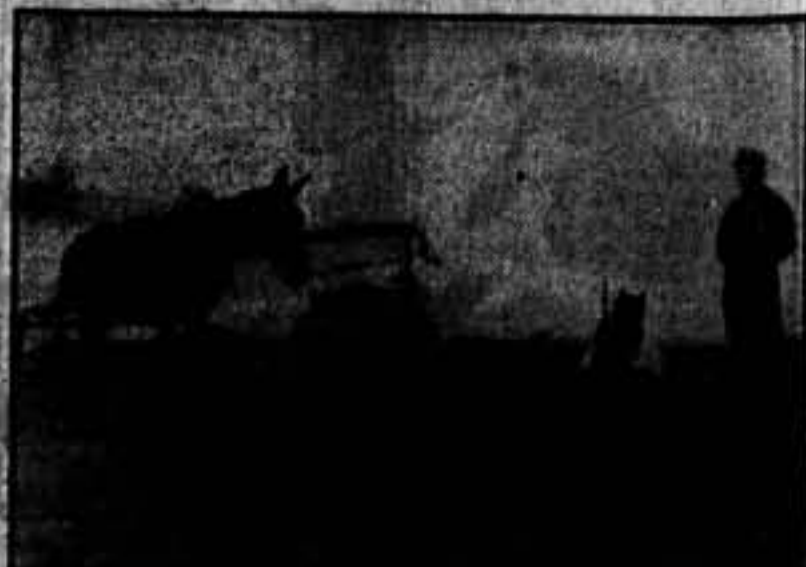
Una noche, vigilada por nuestros milicianos.