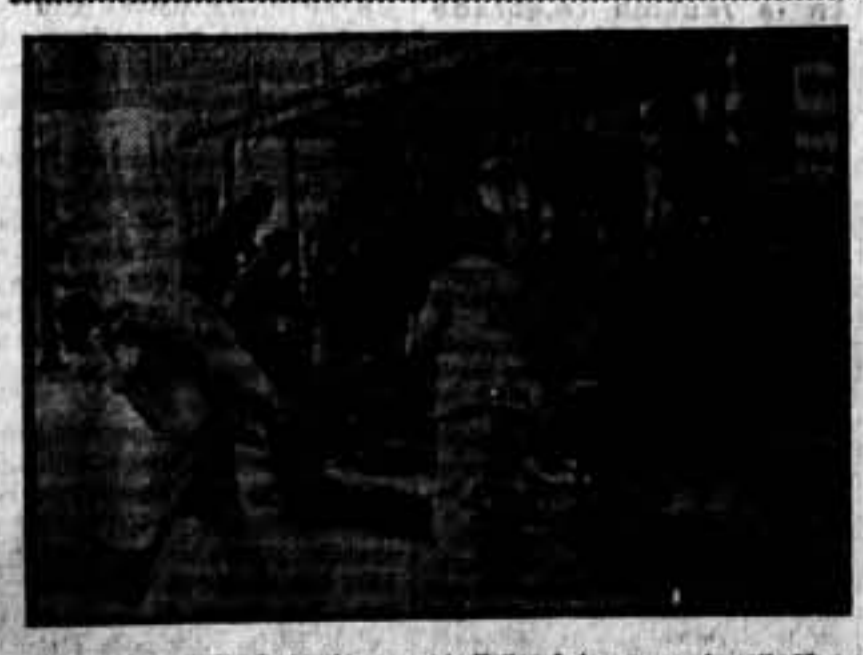
Lo mismo en la calle de Alcalá, que ante Bellas Artes, que en la calle Mayor, ante la Alameda, los vendedores se prestan gustosísimos a la descarga de los productos alimenticios enviados por los camaradas rusos para el abastecimiento de los soldados que tan heroicamente luchan por su libertad.

Se ruega a todas las publicaciones avícolas de España, manden un ejemplar al Sindicato Unico de Avicultores y Cunicultores de Cataluña, Via Layetana, 32.