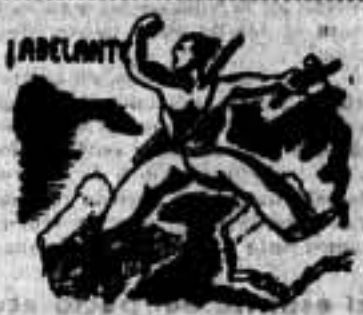
A otra España libre y trabajadora