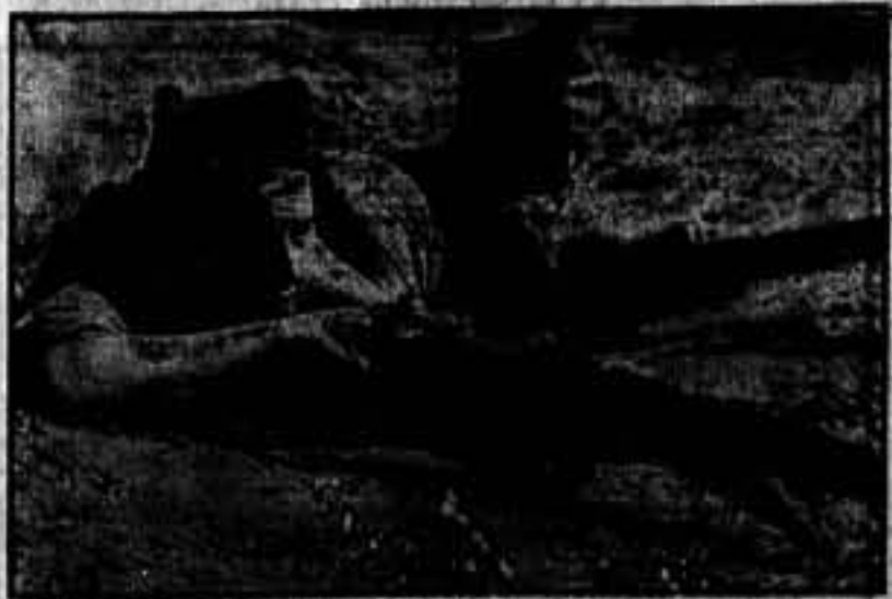
Esta miliciante, de la columna "Bojo Negro", que combate en las avanzadas de Huesca, con su fusil defendiendo la libertad de la República como cualquier miliciante.