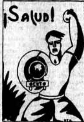
Los defensores del carril saludan a la Revolución

Estos incidentes han aumentado considerablemente el interés del público francés por los debates del Congreso.