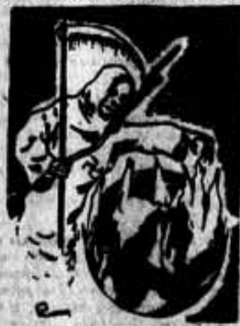
Hermanos todos: Solidaridad. El fascismo de la guerra amenaza al mundo

Moscú, 23.—La Asociación Musical ha publicado una serie de canciones consagradas a la lucha que sostienen los trabajadores españoles. Ha editado 25.000 ejemplares de la canción "Vamos", del compositor español Gallote. La misma tirada se ha hecho de la canción "Fraternidad", de Solmedina, así como de "Al ataque", del quinto regimiento. Están en prensa otras canciones de diversos compositores.