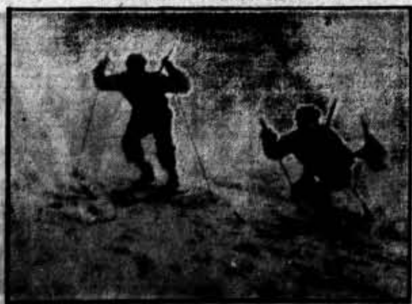
Un detalle de la notación de los milicianos del 4.º Regimiento, pertenecientes al batallón alpha.