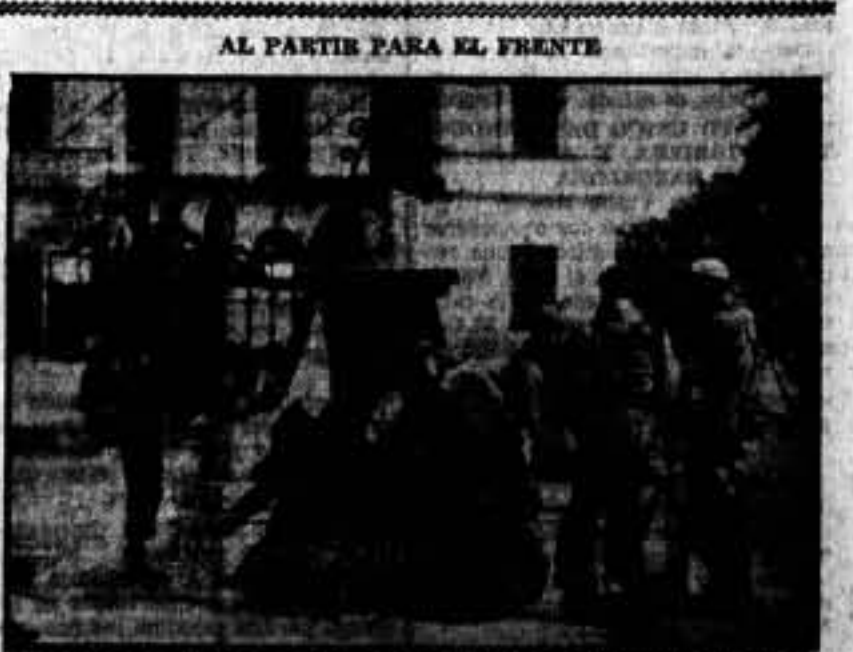
Un trago de agua en la fuente del pueblo, antes de marchar.

También se hace extensivo a todos los obreros confederados, esta nota, para que se abstengan de hacerle limpiar las botas, los domingos, después de dicho horario. — La Comisión técnica.