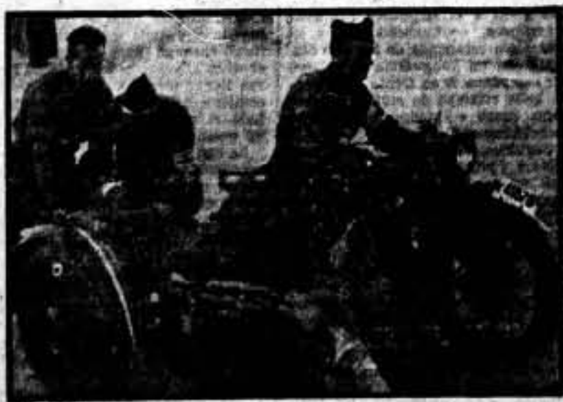
El servicio sanitario motorizado da excelentes resultados en los frentes de lucha.