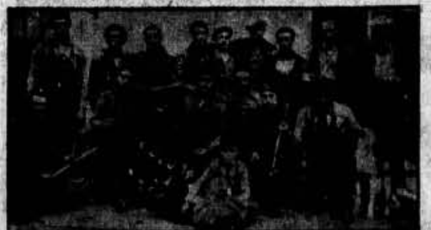
Grupo de camaradas de San Guim (Lérida), que han salido para el frente aragonés, en la columna de SOLIDARIDAD OBRERA.