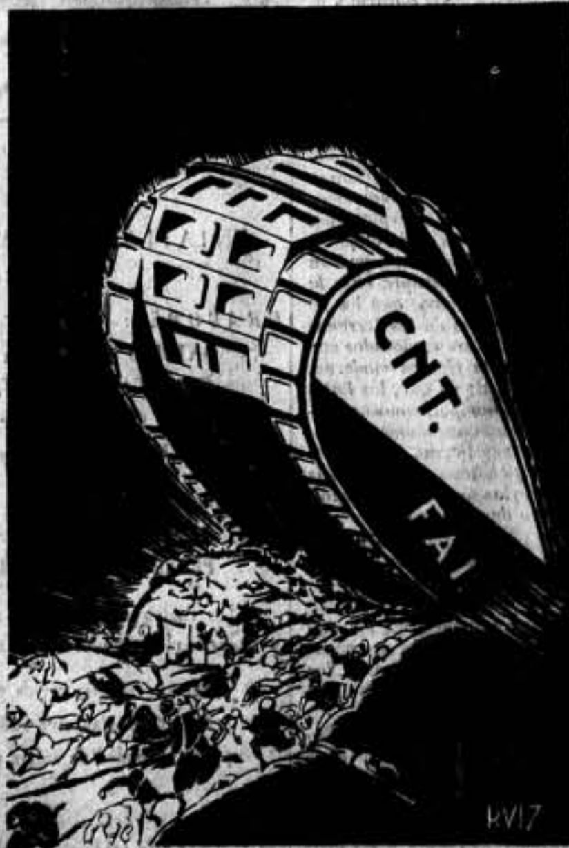
Las hordas fascistas sucumbirán bajo la fuerza aplastante de las mismas confederadas.