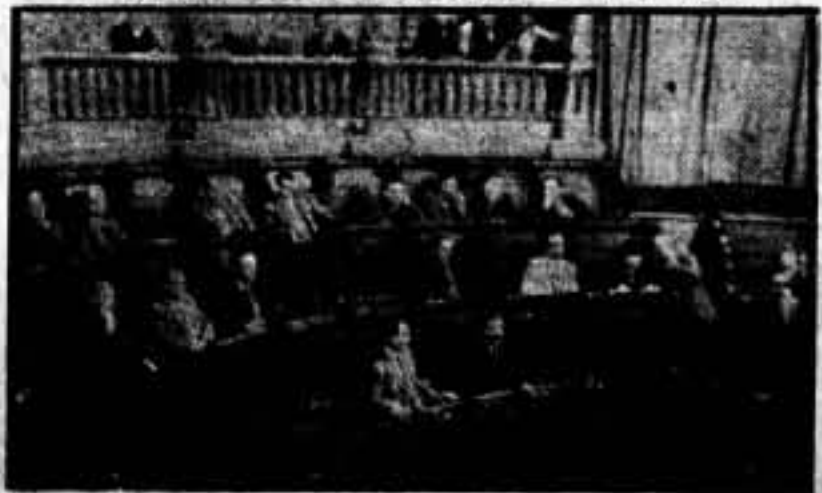
Los regidores obreros en la sesión inaugural. En primer y en segundo término, los representantes de la C. N. T. en el Consejo Municipal.