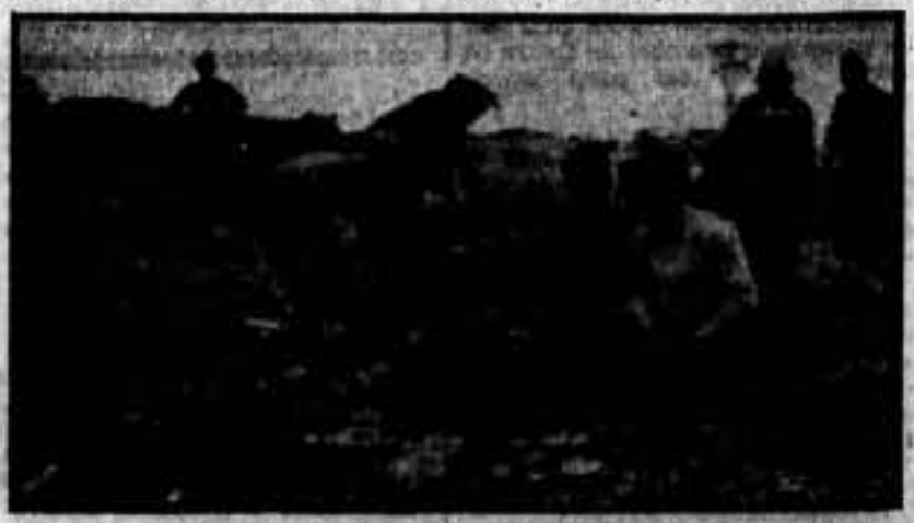
Construcción de abrigos.

Sigamos luchando con tesón, y desempeñando, con toda la buena voluntad que es la propia de los combatientes que defienden el estandarte de la libertad y de la manumisión social, la misión revolucionaria que la hora presente nos ha deparado.