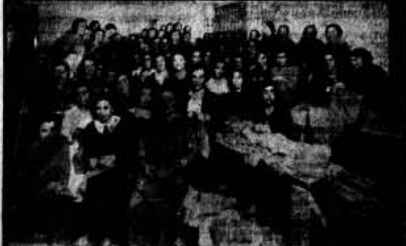
Los compañeros de la fábrica Pich Aguilera, de Kuhl, que confeccionan jerseys para los camaradas que luchan en el frente.

"¡La comedia internacional fascista "é finita"!..."