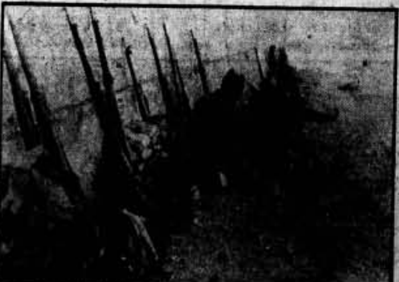
Un descanso para reponer las fuerzas y seguir luchando con ímpetu.