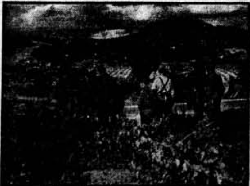
Nuestras baterías disparando contra el enemigo.