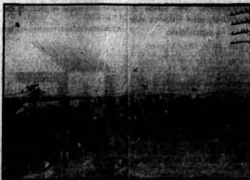
Avanzadilla, en uno de los frentes, batiendo al enemigo.