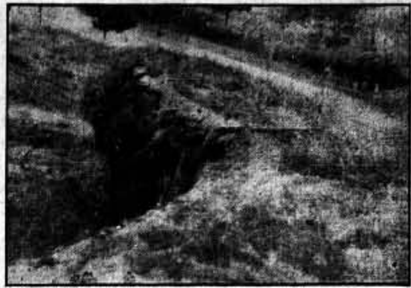
Desde una trinchera construida junto a la carretera, nuestros milicianos esperan el paso del enemigo.