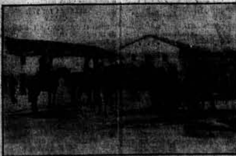
La jornada de ayer en el frente extremeño fue de extraordinaria importancia. Se ganaron el monte de Alcañiz y otras zonas. En todas ellas ha quedado...