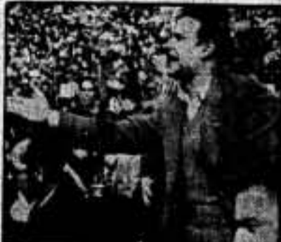
Sesé, representante de la U. G. T. habla en pro de la unidad

(En este momento llegan a la plaza los cónsules de Rusia y Méjico, que son recibidos con grandes aplausos y los vivas de rigor.