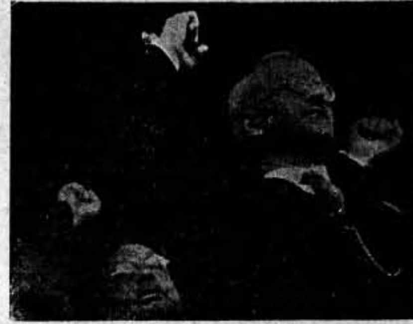
“La Internacional” deja oír sus acordes. Los cónsules de Rusia y Méjico, en el palco presidencial, levantan sus puños como un juramento y como una amenaza.

lebrando era la demostración de la necesidad de haber llegado a la unidad de acción de todas las organiza-