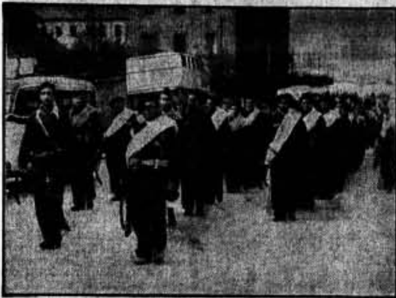
Salida de una de las columnas para el frente.