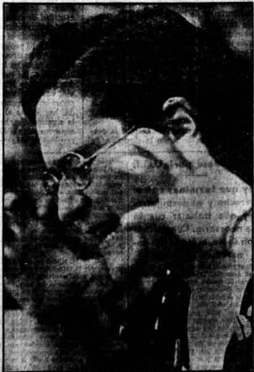
"Como la leona protege a su cachorro, así debía defender a vuestros hijos." Federica Montseny en un momento culminante de su discurso.

baladros ros an vuestro nosotr el mi conside menos palabra dos a transcu pero oc mos. I frenta interior es Espi su comi trijunfo Francia ha pres España. del fasc blo bel present mundo fo de la Si ve afectad si nosot za de la crítica, nada no ne. Im existen pueblo. frente a fensa d tinuado rusa. C otros lo nuestra uno de crecer miento ra que y la e grada segurid men ve toría y pre los tos hab osa, se tilla, f cadáver el pue Bastilla tu form Me o valquir un empi mueren heridos el piso recogim el comp tes, ha con el siente ra defe ¡Sab de los liendose a Españ presidn peniten bed que traron cha de hicieron afos? I eficacio miercen partes, barbilla un con Le cogi le desp caba a los que Coruña le prep