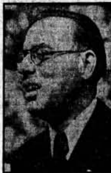
COMORERA, DEL P. S. U. C.

"...En el frente se han introducido espías; cuando son detenidos se les fusila. Si entre nosotros, en la retaguardia, se descubren estos elementos, se ha de hacer como en el frente: Fusilarlos."