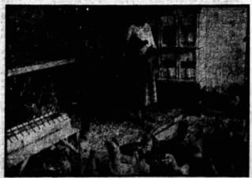
Una campesina controlando la puesta. Cada gallina lleva en la pata una señal, con su número correspondiente; al entrar en el ponedero registrador, automáticamente queda marcada. Una vez ha puesto, el encargado del control la sujeta, mira el número y le anota el número en la ficha mensual, disponible al efecto. Hay infinidad de sistemas de selección, pero ninguno tan eficaz como el control de la puesta.