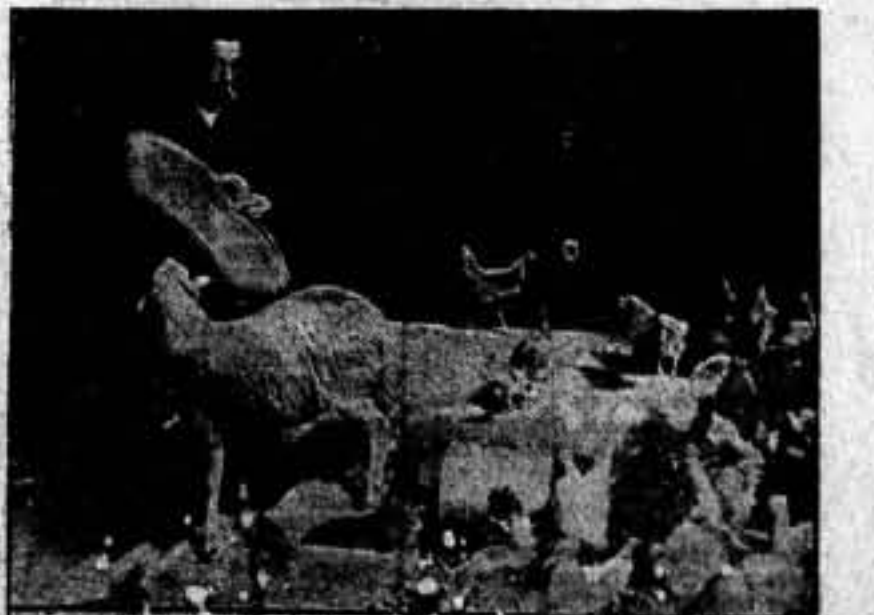
He aquí el tradicional y antieconómico gallinero rural, donde la higuera y la selección brillan por su ausencia. Las aves, en proximidad de raras y de todos los pelajes. El maíz lo comen a todo pasto, resultando un formidable desequilibrio en la alimentación. El conejo, el perro y hasta la burra, forman a veces tal revoloteo en el corral, que si alguna gallina está incubando, abandona los huevos por el ruido.

Se precisan treinta de los compañeros albañiles alibitados en la Columna de Fortificaciones para que puedan empezar seguidamente su trabajo. Deberán dirigirse a la Comisión Técnica de Albañiles y Peones del Sindicato del Ramo de Construcción y al presentarse deberán llevar consigo sus herramientas para el trabajo.