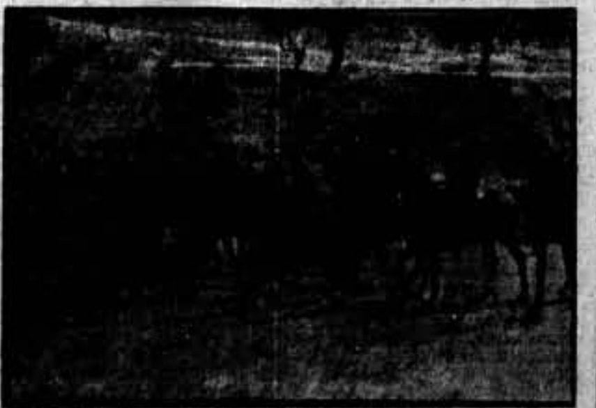
Un avance lento y constante para conseguir el objetivo propuesto.