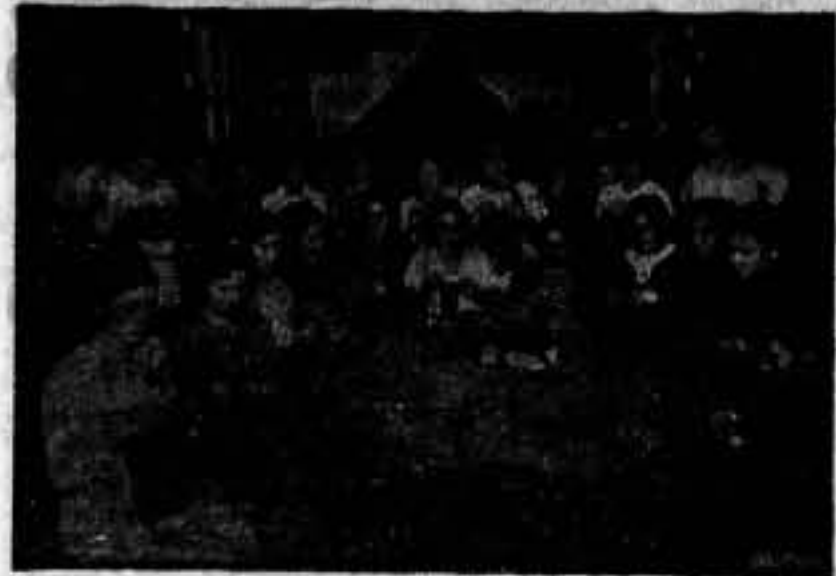
Estas compañeras, de la Sección de Domésticas, del Ramo de Alimentación, de Badalona (C. N. T.), después de las horas de trabajo, se reúnen en el Sindicato de Alimentación, donde se dedican a confeccionar jerseys para los compañeros del frente. Heias aquí en su Secretaría, la que han convertido en taller y la que piensan transformar en estudio, para aprender a leer y a escribir la que no sepa. Esta es la obra que hacen en Badalona las compañeras sirvientas de la Confederación Nacional del Trabajo.