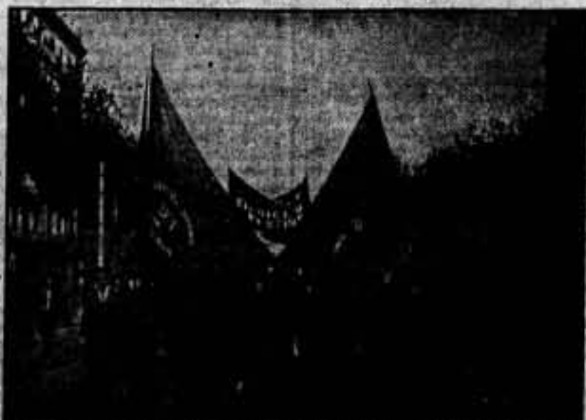
En la imagen de la U. G. T., celebrada en la Monumetal de la C. N. T., se ve a un grupo de militantes de la U. G. T. en el momento de su ingreso a la Monumetal.

MITIN MONSTRUO EN LA MONUMENTAL C. N. T., U. G. T., F. A. I. P. S. U. C.