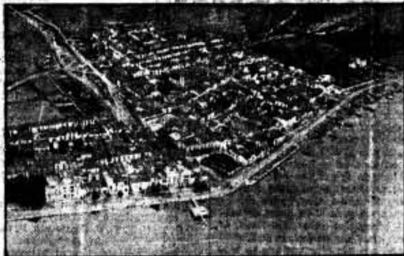
Vista general de la villa de Rosas.