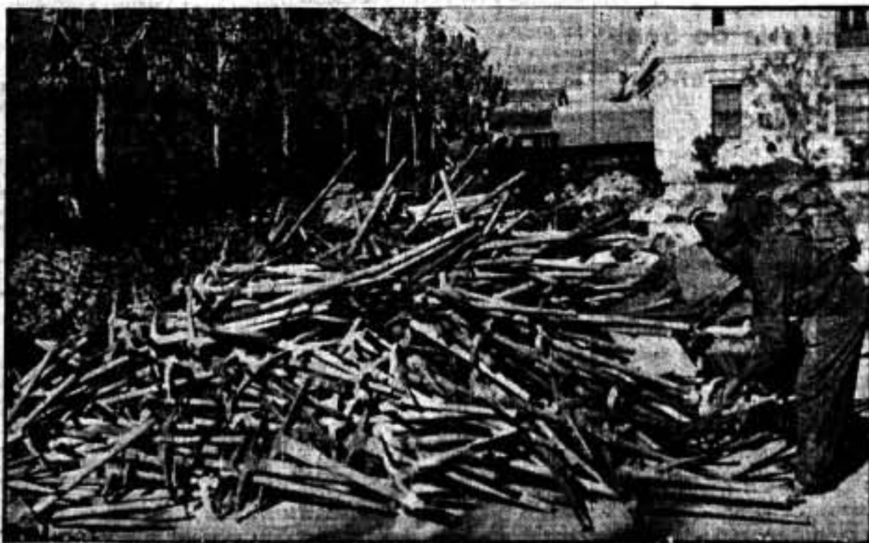
El pueblo ha respondido al llamamiento hecho por las organizaciones obreras de depositar pajas, picones, cañerías, sacos y demás elementos del Ramo de Construcción, en los Cuarteles de Torpedo, debido al intento de desembarco de fuerzas fascistas en Rosas.