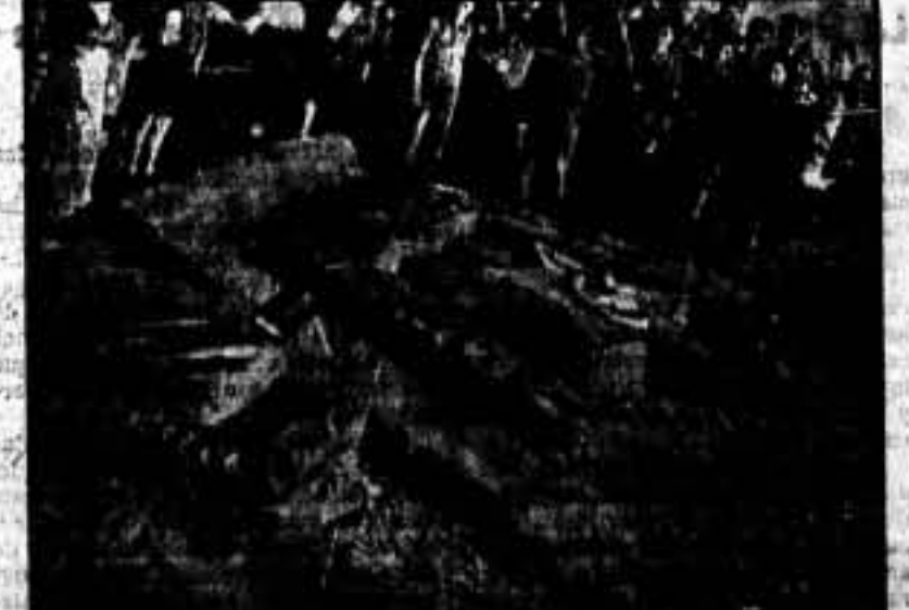
Los niños de la calle de Vallespr, en favor de las víctimas.