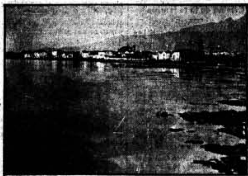
El lugar por donde intentaron desembarcar los fascistas, en Rosas.

La calma sonriente de Rosas se transformó en un momento en la ira de un Pueblo digno, dispuesto a no someterse jamás