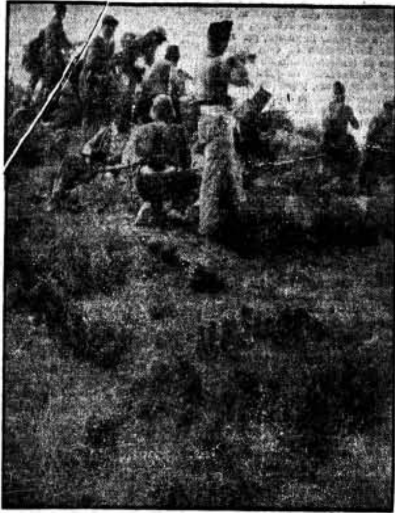
Parte de la columna Maroto, frente al enemigo.

(Información para SOLIDARIDAD OBRERA, por Morales Guzmán)