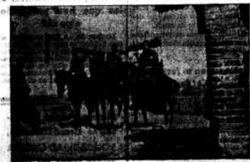
Los niños juegan impacientes por andar. Es que se les da cuenta de lo que se lleva haciendo a las avanzadillas. Saludemos a los compañeros de los servicios de enlace.

Por mediación de SOLIDARIDAD OBRERA ha llegado hasta nosotros el rumor de que en la reiguardia existen aún enemigos nuestros. Ya que su cobardía les impide echarse a la calle con las armas en las manos, nos combaten con sus lenguas mentirosas, lanzando bulos y noticias derrotistas que no existen más que en sus imaginaciones calenturientas.