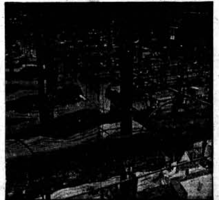
Parte del taller de confección de ropas, durante un descanso de los obreros.