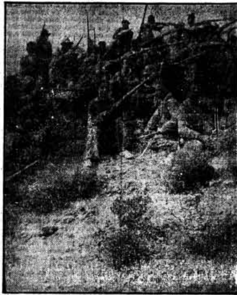
Un momento de coordinación de los esfuerzos del Grupo núm. 11 de la columna Maroto.

La Federación Local-Provincial de Sindicatos Unicos de Granada viene desarrollando una grandiosa labor que, en su día dará fruto. A todas partes acude su Secretariado, y en todas partes encuentran eco todas sus iniciativas. Nuestros ideales anarquistas van tomando cuerpo prácticamente en todos los problemas de orden moral y económico. Somos invitados a ir a la solidaria ciudad de Baza. Vamos con varios delegados de la Federación, con el fin de recoger información de la vida económica, sindical y anarquista de Baza.