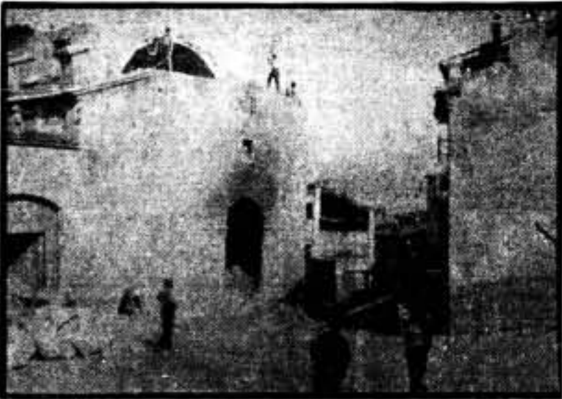
Obreros empleados en el derribo del convento de monjas de clausura de Santa Clara, que ocupaba una importante extensión de terreno, donde se levantará un soberbio Grupo Escolar de Caspe, y en el que será educada la infancia que es el porvenir de días futuros.