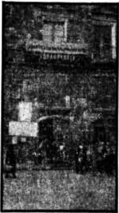
Una vista parcial de la fachada donde está instalada la Comandancia del Cuartel General de las columnas Sur Ebro

Bajo un sol primaveral partimos de Barcelona, ciudad espejo del Universo ante los ojos del proletariado internacional; cuna y sepulcro de grandes luchadores y pensadores; símbolo de un porvenir venturoso, a las doce del día.