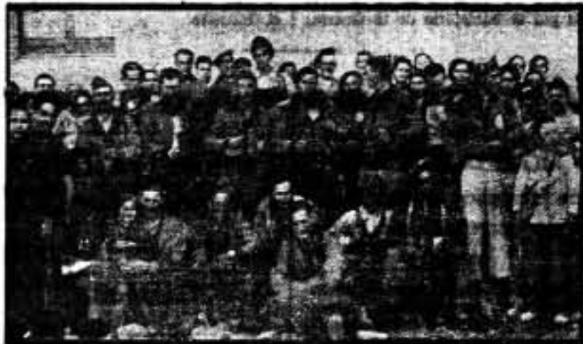
Grupo de compañeros de Amposta, pertenecientes a la C. N. T., que han marchado voluntarios al frente.

Los comaradas de Amposta han respondido a la consigna dada en el mitin de la Monumental. Al frente y en la retaguardia