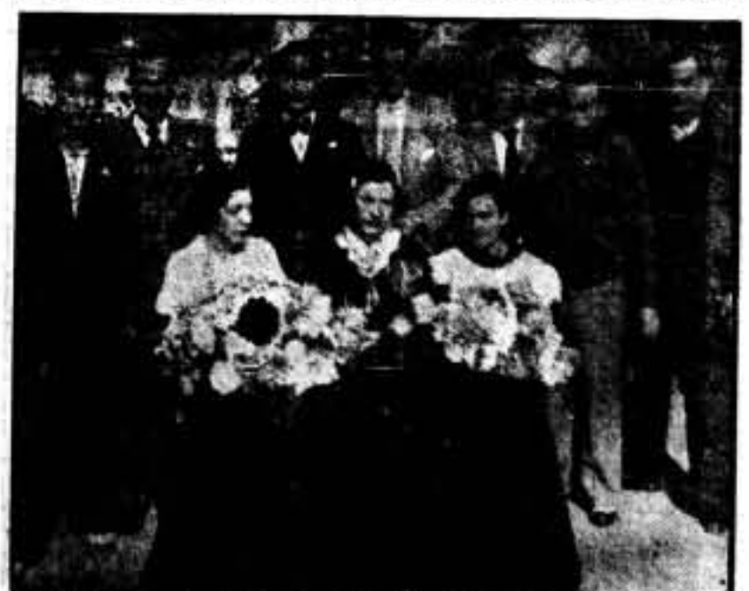
Organizadores del festival Pro Víctimas del Fascismo, que se celebró el día 25 en el campo del "F. C. Martinec".