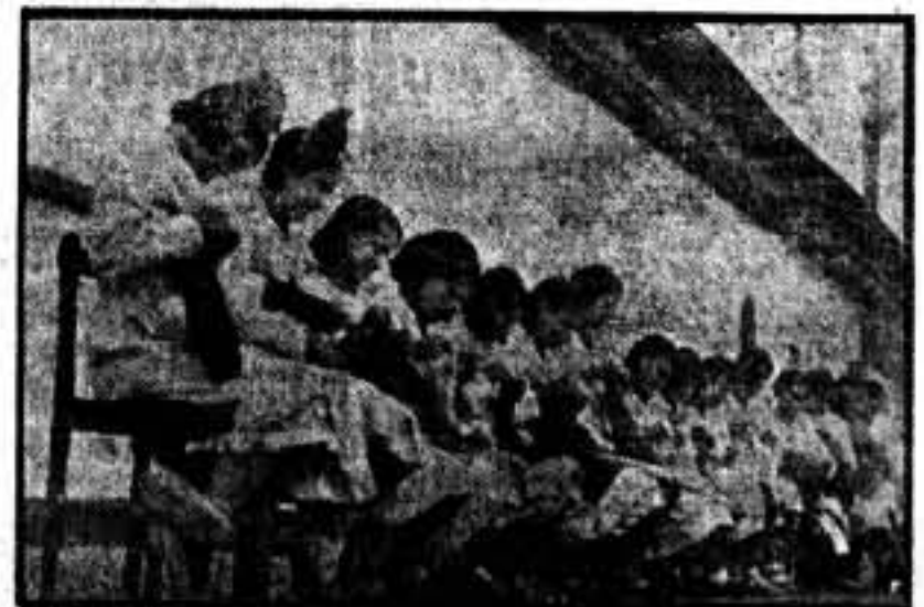
Infinidad de niñas de los grupos escolares madrileños, dedican sus horas de recreo a confeccionar ropas para los milicianos. Es aquí un grupo de "mayoras" del grupo "Luz Viva", entregadas a tan simpática obra.