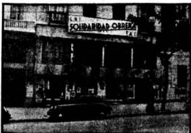
La delegación de SOLIDARIDAD OBRERA en Madrid. El típico de la calle de Alcalá, arteria de ministerios y de cafés-tertulia, donde en otros tiempos se fraguaron políticos e ídolos, tiene un aírón grave y serio. Y se lo han brindado la C. N. T. y su diario.

El consejero de Economía recuerda que mientras se cumplen los trámites necesarios para la aplicación del Decreto de Colectivizaciones, ha dado aviso a todas las organizaciones de la Generalidad y de una forma especial a la Oficina Reguladora del Pago de Salarios y a la Caja de Descuentos y Pignoraciones, con el fin de que los actuales Comités Obreros de Control y Comités de Fábrica tengan las mismas facilidades que hasta el presente para que puedan atender a las necesidades de las respectivas empresas y muy especialmente para el pago de jornales a los obreros.