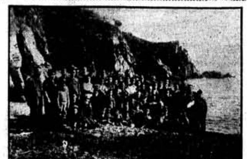
Los niños y niñas de Pina de Ebro, refugiados en Blanes (Gerona). Nuestra copia es copia de opt. n. n.

¡Salud, camaradas de América! ¡Salud, parias del mundo entero! — El Comité.