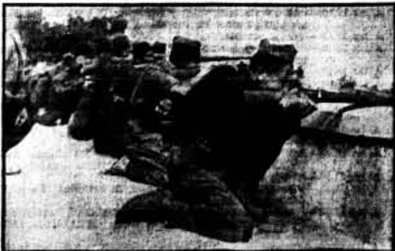
Desde el perfil de un puente, nuestros heroicos luchadores hostilizan fuertemente al enemigo, que se obstina en pasar por un camino vedado por los bravos combatientes de la República.