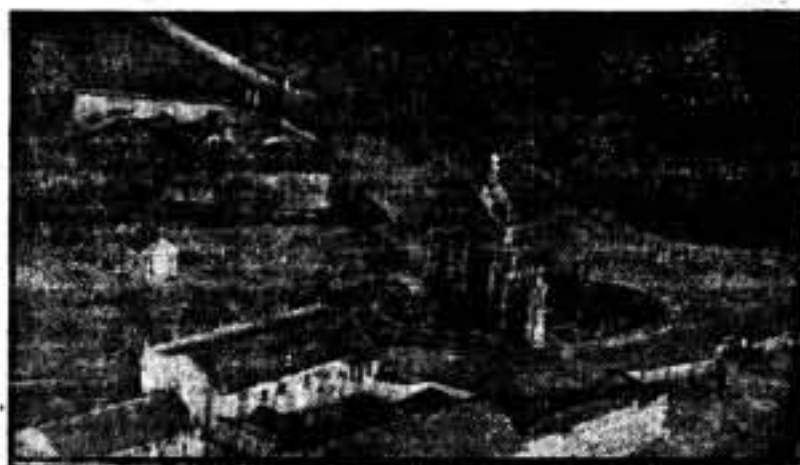
Puerta de Hierro.

La batalla de Madrid se extiende del Cerro de los Angeles a la Casa de Velázquez, atravesando Puerta de Hierro por un lado y el Puente de Toledo por otro. Pero en todos estos puntos neurálgicos, se tiene atenazado al enemigo