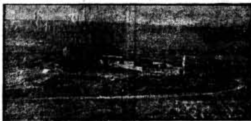
El Cerro de los Angeles antes del 19 de julio.

gulado a estas horas. Puerta de Hierro podría hablarnos de muchas escenas de galantería de la corte fernandina. Fue uno de los sitios predilectos de Godoy. Como toda la carretera que se extiende a derecha e izquierda de la famosa Puerta, esos mismos lugares tienen recuerdos repetidos de las diferentes veces que en el curso de la Historia los moros han querido tomar Madrid, desde los tiempos de Yusuf, el de Magerit, cuando la Villa no pasaba de ser un "castillo famoso", como dice el romance.