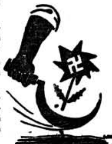
LA MALA HERENCIA

La columna Durruti inspira respeto por su abnegación heroica, habiendo dado su sangre por la defensa de Madrid.