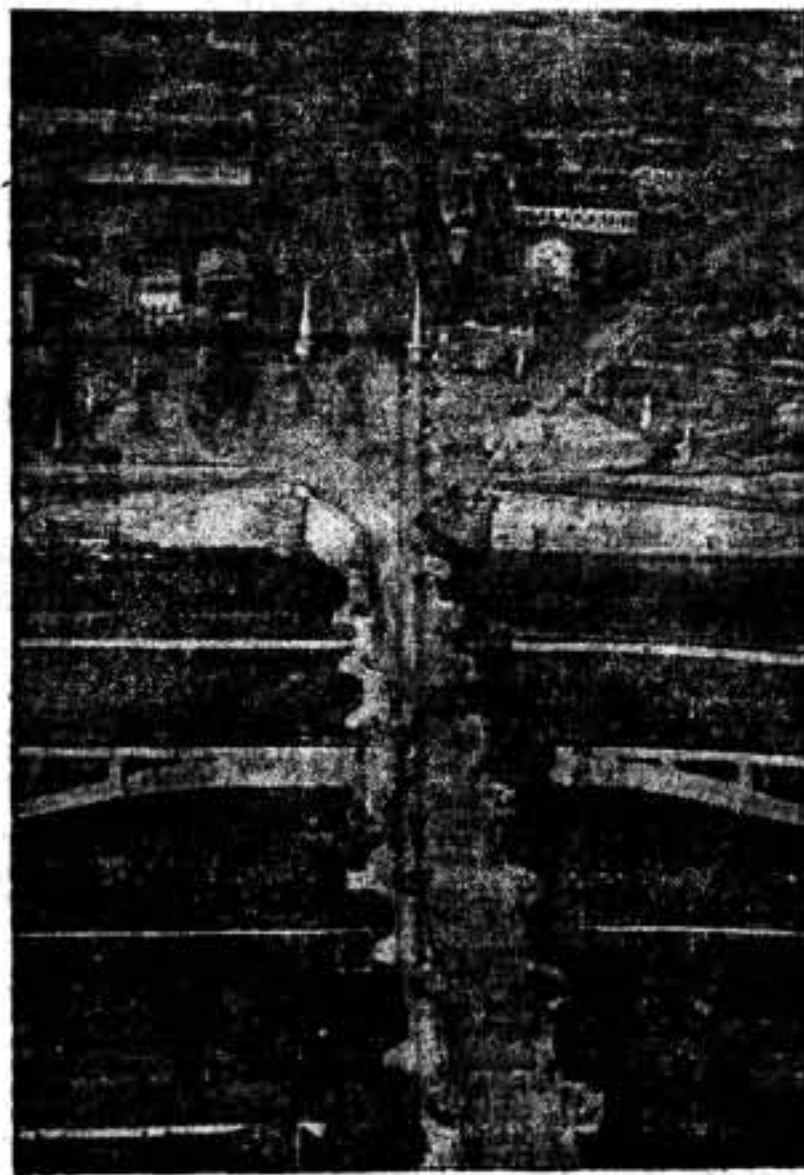
Puente de Toledo.

o cuatrocientos suicidas. Protegidos por dos tanques tomaron el edificio y en él instalaron una avanzadilla. Los audaces fascistas que tal hicieron no pueden contar ya su hazaña. Nuestras milicias rodearon en la mañana de ayer la Casa de Velázquez y coparon a sus ocupantes, limpiando la serena mansión de los artistas franceses amigos de nuestra pintura de aquella basura militarizada que por unas horas profanó el recinto del arte y el estudio.