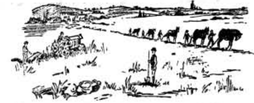
Animosos, tenaces, roturan la tierra que promete espléndida cosecha, ofrenda revolucionaria.

muchísimo más descansada que la que ahora realizan. Comprendiendo lo que significa la agricultura para la consolidación de la nueva etapa que estamos viviendo, no vacilaron en poner su inteligencia y su voluntad de probados militantes al servicio del agro. Y desde que amanece hasta que muere el día, trabajan en esas 600 hectáreas, entre bosque y tierra de cultivo, que posee la granja. Como que es mucha la labor que precisa realizar para poner las tierras en condiciones de cultivo y para los efectos de la siembra, estos camaradas trabajan incluso los domingos. Saben que si en la obra revolucionaria, que con las armas se hace en la vanguardia, no existen fiestas, tampoco debe de haberlas en la tarea revolucionaria que con las herramientas se efectúa en la retaguardia.