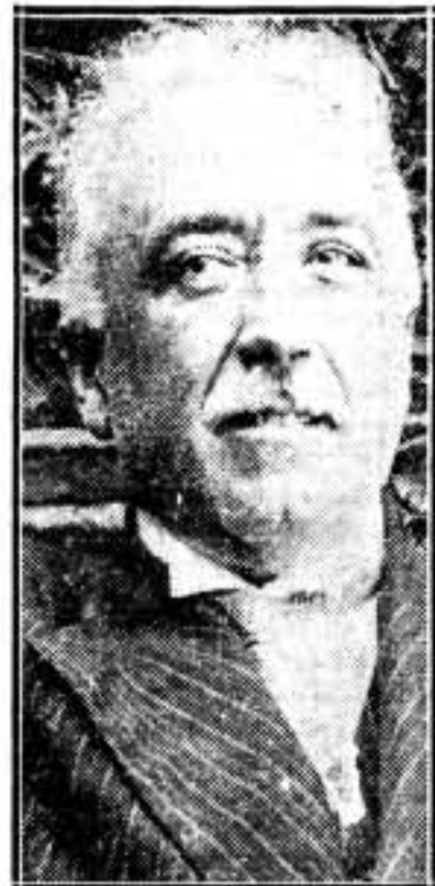
RESURRECCION DE UN VIEJO CACIQUE GALLEGO

Se comprendió que después de la caída ridícula de Gil Robles, Alcalá Zamora era su hombre, y, puestos al habla con él, se iniciaron las gestiones para impedir a toda costa el acceso al Poder del Gobierno del Frente Popular y, sobre todo, la reunión de Cortes, especie de Convención, en la cual habrían de discutirse problemas que afectaban al régimen capitalista y, sobre todo, en lo que más interés se ponía era en evitar que se discutiera los crímenes cometidos por el Ejército y la burguesía en Asturias, que dieron lugar a la espontánea represión que presidió e inspiró el ex emperador del Paralelo, don Alejandro Lerroux y García.