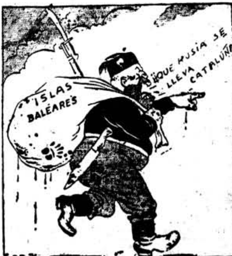
El ladrón, para despojar: —¡A con, a con!