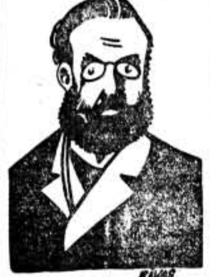
Silveira, político tan ignorante y pedante como Maura

La política la dirigían los banqueros, que financiaban las guerras para luego explotar las conquistas.