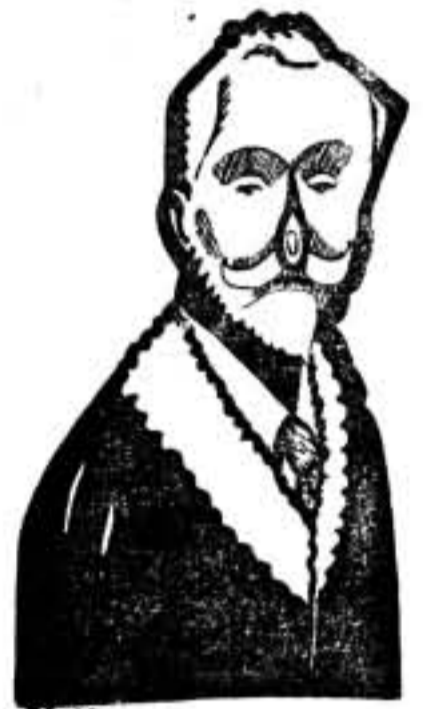
Antonio Maura, entregado en manos de la Diplomacia ignorante y de los militares cretinos

Los Reyes Católicos y los Austrias trabajan para la casa de Borgoña y para los Habsburgos. Vencidos, y moribundo el fantasma de nación, pasa la explotación a los Borbones, que la administran como dependientes de la casa central, establecida en París. Es esta la época del Pacto de Familia. En los tiempos austríacos el pacto con los Habsburgos fué, sin declaración oficial, igualmente efectivo.