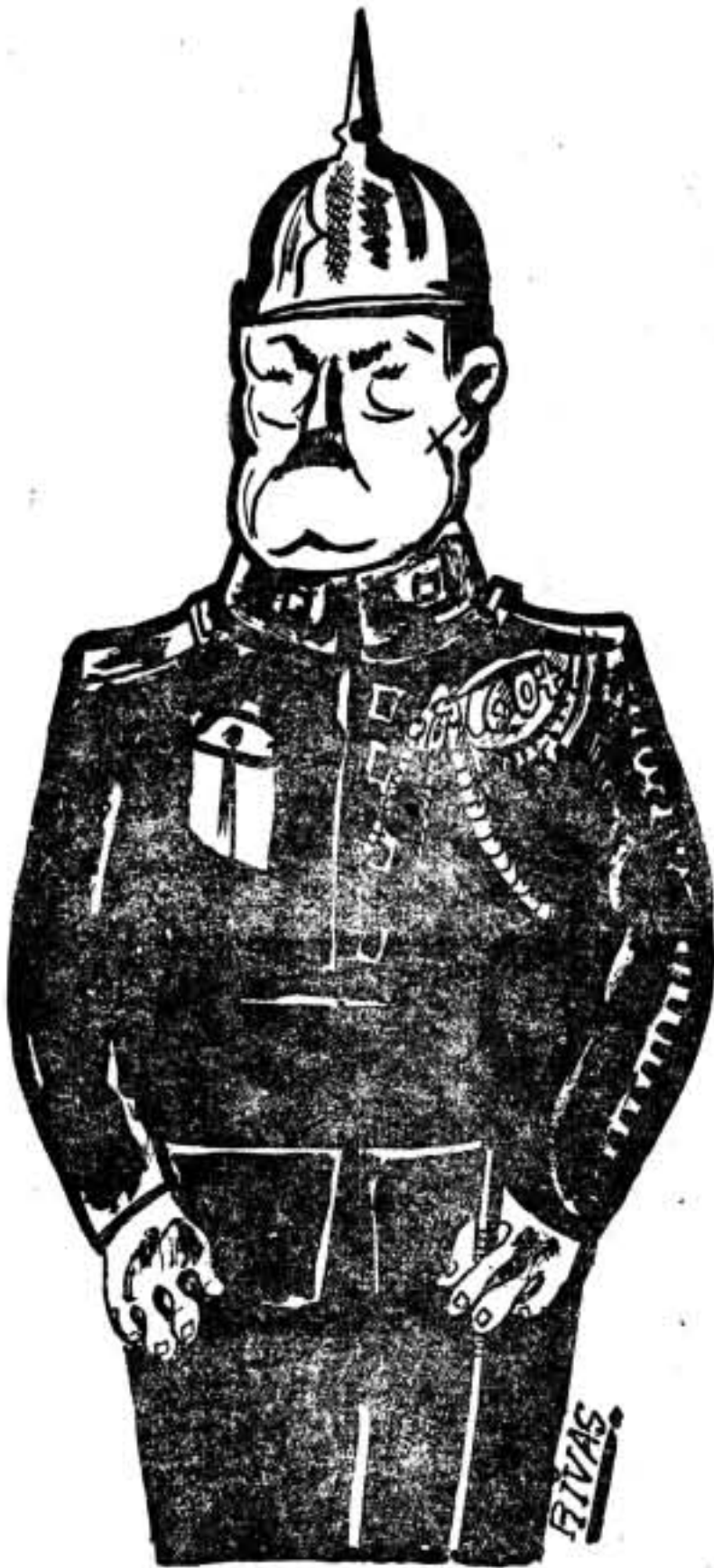
El mayor criminal de la época y anormal sexual por añadidura.

mano la presa, se les ha escapado para siempre, y al desencadenarse la verdadera revolución, la que el pueblo español llevaba en su pensamiento y en su corazón, revolución magnífica que esos falsos republicanos han intentado en vano desviar y mixtificar, se ha originado el estrepitoso