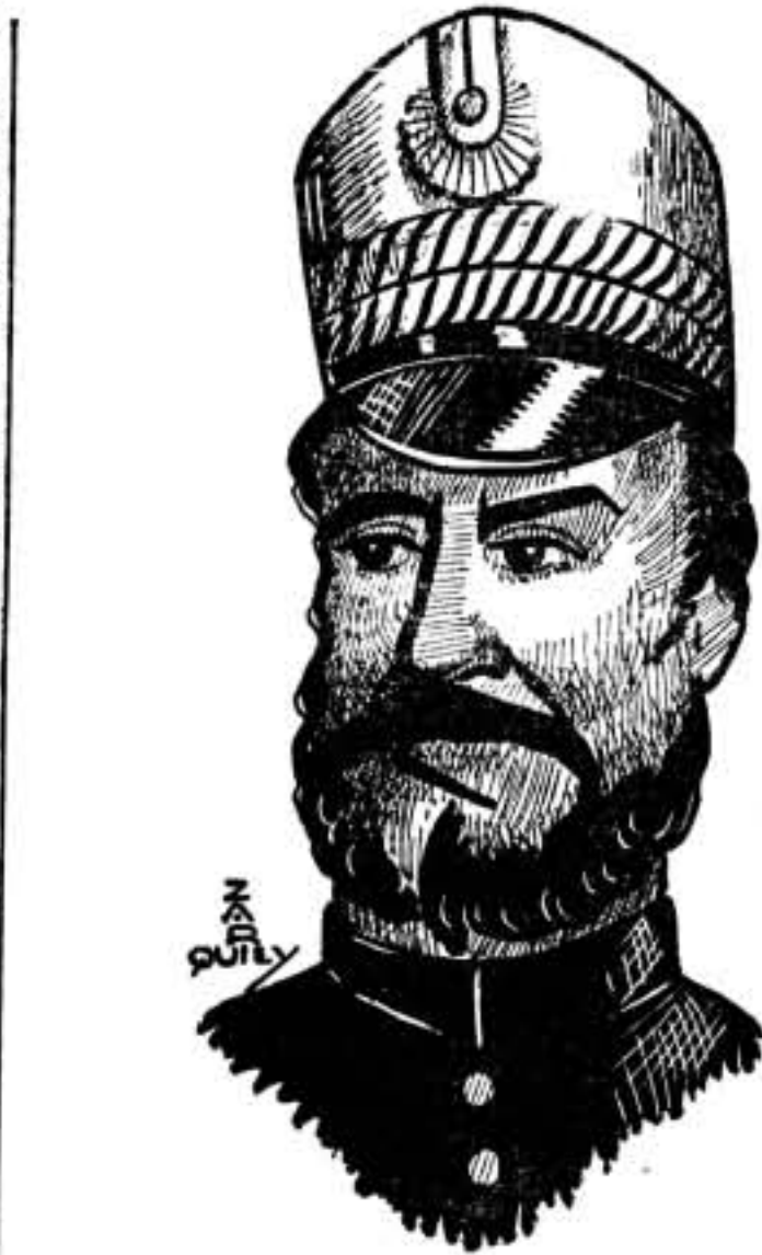
EL GENERAL PRIM

El recuerdo de que, gracias a la aguda directiva de España, los Estados Unidos pudieron obtener su independencia, es otro argumento más