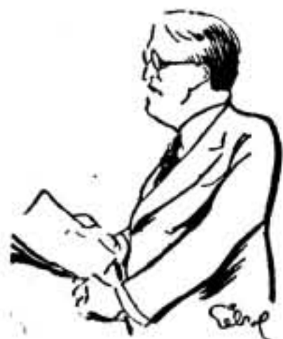
ALVAREZ DEL VAYO

Sociedad de las Naciones. Como resultado positivo de la reunión pueden señalarse los siguientes puntos: