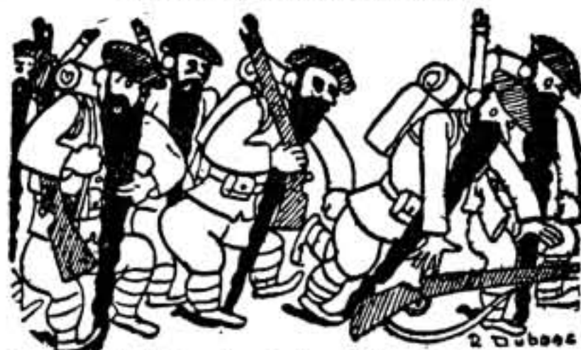
Los mercenarios de Franco han jurado a la Virgen del Rocío no afeitarse hasta haber conquistado Madrid.