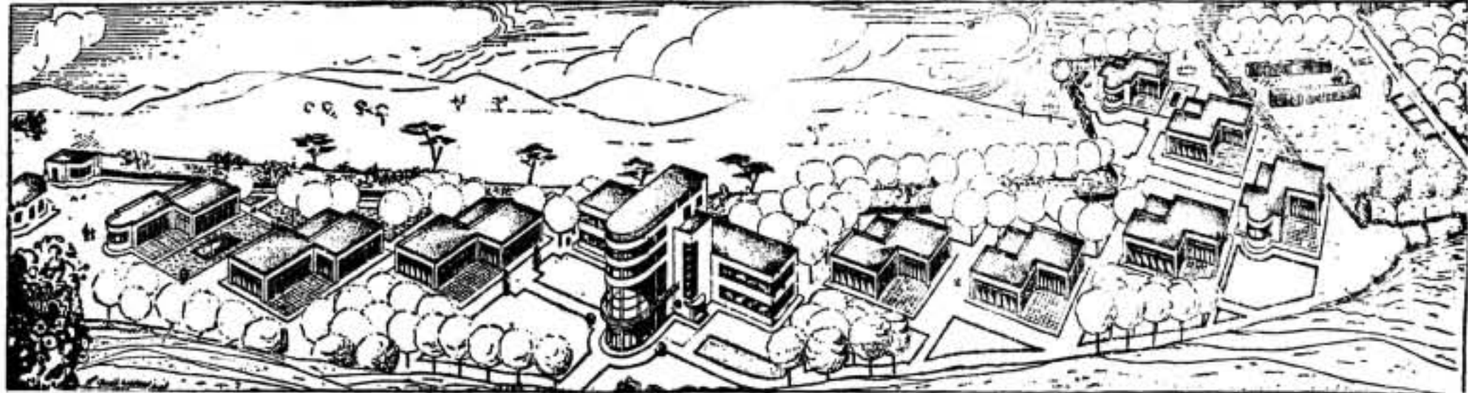
Proyecto de Escuela Nueva de Girona

Y los que un día propagaron el celibato, empiezan a fijarse en las mujeres. Comprende, que algunos padres de la Iglesia fueron injustos con la mujer, y muchos de los que fueron curas quieren casarse o unirse. Se han vuelto campesinos y, olvidando el precepto cristiano: «santificarás las fiestas», trabajan incluso los domingos, atentos a las necesidades de la guerra. ¡He ahí una redención que nunca debieron soñar!