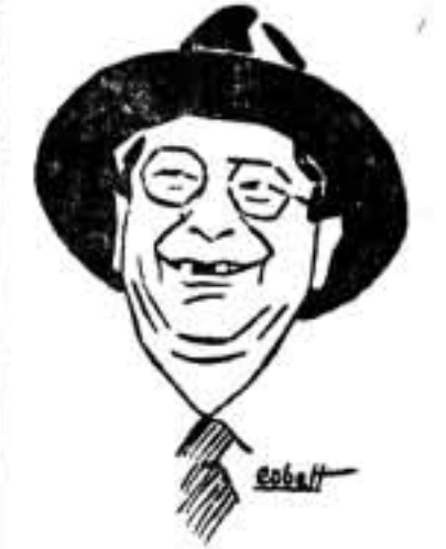
Hubo un momento en que creyó que Sánchez Guerra era el predestinado; luego se fijó en Ossorio y Gallardo. No se daba cuenta el iluso escritor que en la República sobraban hombres capaces de reprimir y asesinar obreros con tanta crueldad como lo hizo el viejo anfitrión en la Commune de París.

Por entonces, la mayor preocupación de este hombre singular era la de encontrar un Thiers para la nueva República, recordando su famosa frase: "La República será conservadora, o no será". En todas sus intervenciones parlamentarias, conferencias, y discursos, pedía, poniendo los ojos en blanco y mirando al cielo, que el Destino permitiera encontrar a un Thiers. En los últimos meses de la Monarquía, su pluma estuvo convertida en una especie de linterna de Diógenes buscando el hombre que se pareciera a Thiers.