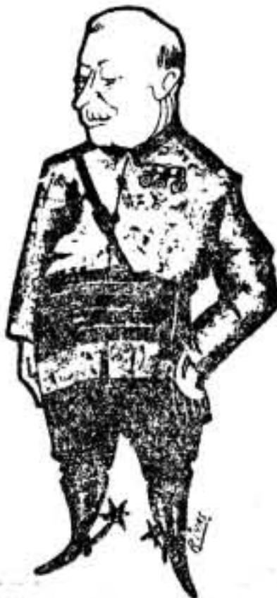
PRIMO DE RIVERA

El resultado de aquellas gestiones fué la aceptación por el Directorio militar del contrato con la Telefonica, que se llamó desde entonces Compañía Telefónica Nacional, aunque de tal tenía sólo el nombre y el dinero, porque el lector va a comprobar de qué forma una entidad extranjera implanta un monopolio con capital español, quedándose con el control y derechos de soberanía, realizando un latrocinio como no se recuerda otro en ningún país. Y no por nosotros, sino a raíz de la palabra autorizada de Indalecio Prieto, que, en un discurso memorable pronunciado en el