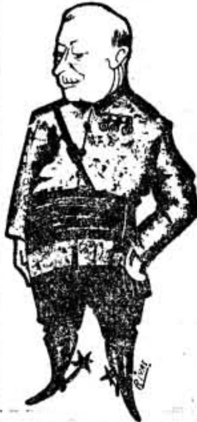
PRIMO DE RIVERA

El resultado de aquellas gestiones fué la aceptación por el Directorio militar del contrato con la Telefónica, que se llamó desde entonces Compañía Telefónica Nacional, aunque de tal tenía sólo el nombre y el dinero, porque el lector va a comprobar de qué forma una entidad extranjera implanta un monopolio con capital español, quedándose con el control y derechos de soberanía, realizando un latrocinio como no se recuerda otro en ningún país. Y no por nosotros, sino a raíz de la palabra autorizada de Indalecio Prieto, que, en un discurso memorable pronunciado en el