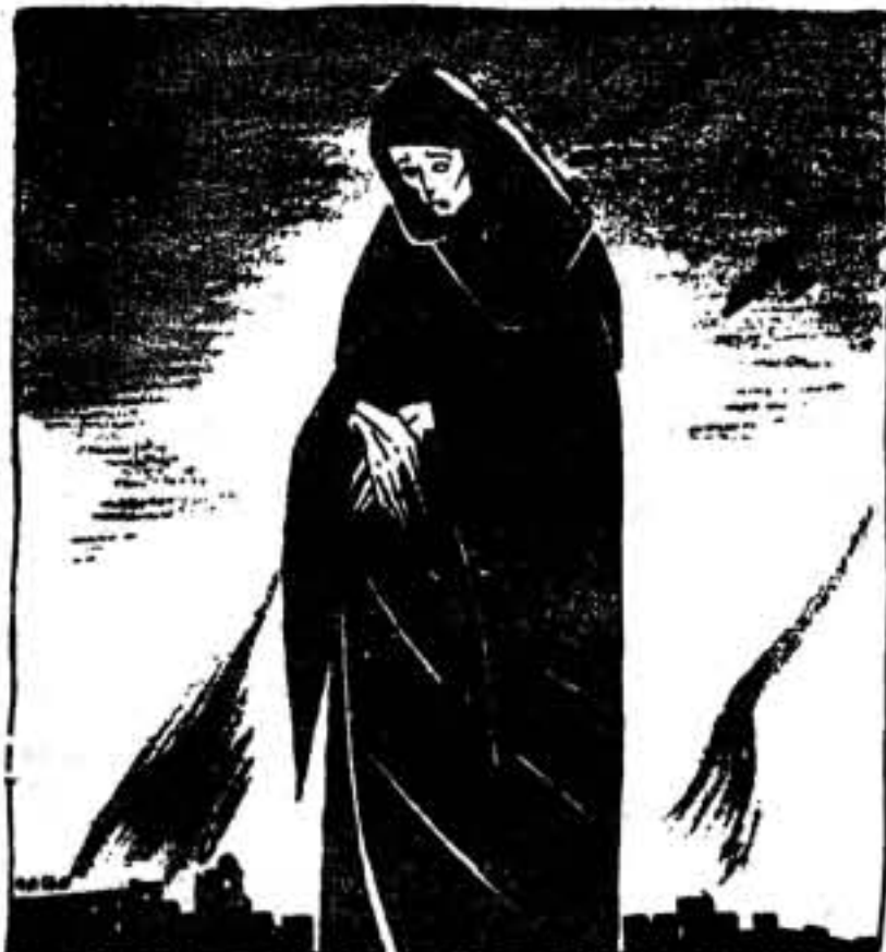
La Virgen? — Este año no parirá. Los aviones fascistas buscan a los niños.

Es preciso dejar a un lado caprichosos puntos de vista poco sólidos y que nada tienen que ver con el momento supremo que vive la Revolución. Es preciso, para ganar la guerra en todos los órdenes de la organización revolucionaria, unidad de acción, unidad de mando y unidad de responsabilidad. Pero sobre todo, en la parte militar, esa consigna de la C. N. T. es imprescindible.