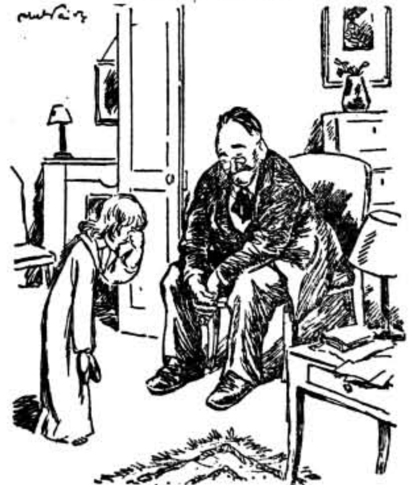
—Nada para ti, pequeña... Este año el Padre Noel no distribuye más que cañones...