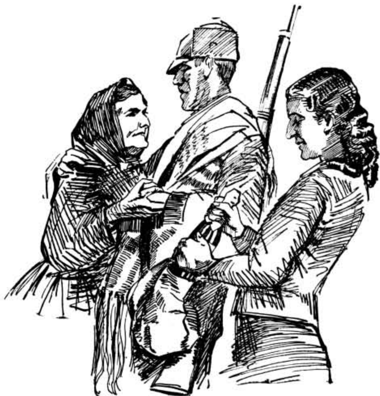
La madre:—¡Salud, hijo mío! que tu fusil deje a España libre de traidores.