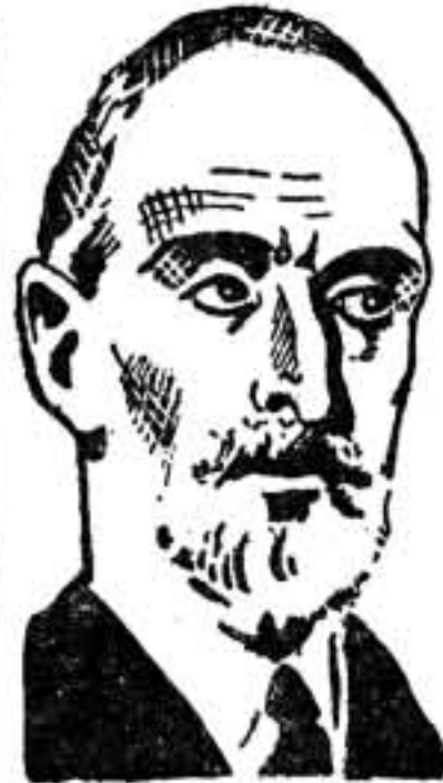
FRANCISCO CAMBÓ, ministro de Fomento en 1918, a quien la plutocracia del carril hizo magníficos regalos en pago a los servicios que le prestó desde el ministerio que explotaba.

Las Compañías ferroviarias fueron, por lo tanto, la más alta y genuina representación del enchufe monárquico. Las autorizaciones se concedían sin plan alguno y sólo para satisfacer intereses políticos y privados, y así, en el transcurso de medio siglo, llegó España a tener 102 Compañías de ferrocarriles, con sus directores, subdirectores, consejeros de administración, asesores y una "empleomanía" numerosísima, que devoraba la mayor parte de los ingresos. Los más conocidos abogados de Madrid cobraban sueldos de estas entidades, y en sus Consejos figuraban destacados diputados, ministros, ex ministros y jefes de partido. Eduardo Dato tenía a su cargo la más alta asesoría de la Compañía M. Z. A. Su yerno Espinosa de los Monteros, ha sido, hasta la Revolución de julio, secretario de esta entidad, y si examináramos una por una las 102 Compañías de ferrocarriles repartidas por toda España, iríamos enumerando toda la fauna político-monárquico-