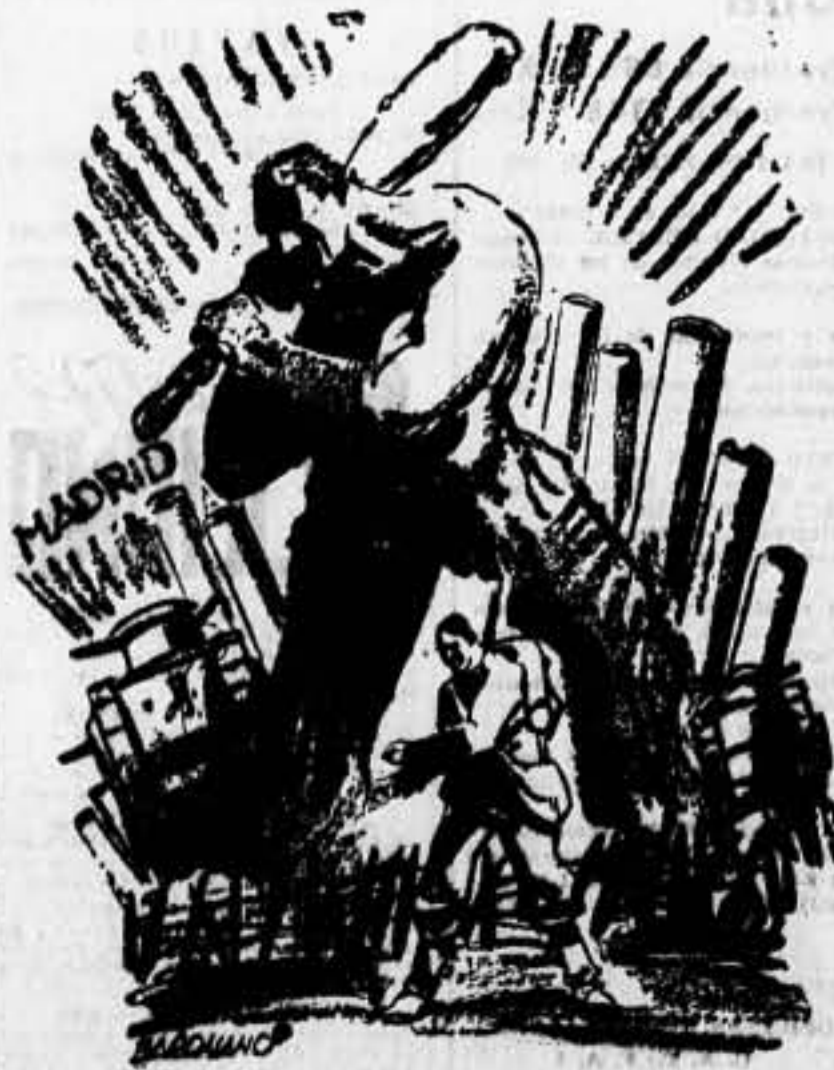
—¡Paese, señores, paese!