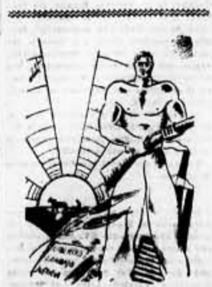
El pueblo armado es la máxima garantía para resguardar la Revolución

Río de Janeiro, 2. — La estación radiotelegráfica de Fernando Noronha, ha captado un radio de Salamanca dirigido a los gobernadores militares de las provincias dominadas por los fascistas, ordenándoles envíen contingentes de tropas al frente de Madrid, concentrándolos en Navalcarnero. Se supone que los rebeldes preparan un ataque sobre la capital paralizando las operaciones en los demás frentes.