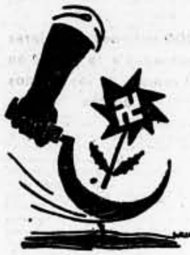
LA MALA HIERBA

La Prensa superfascista europea, acoge, durante estos últimos días, toda clase de noticias tendenciosas, en relación con el suministro de armas por parte de la industria norteamericana...