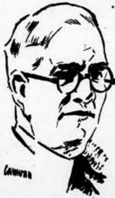
El ministro de Estado pronunció ayer un discurso en Valencia, del que seleccionamos los siguientes temas:

"Alemania viene acentuando cada día su política intervencionista y agresiva en todos los tonos"