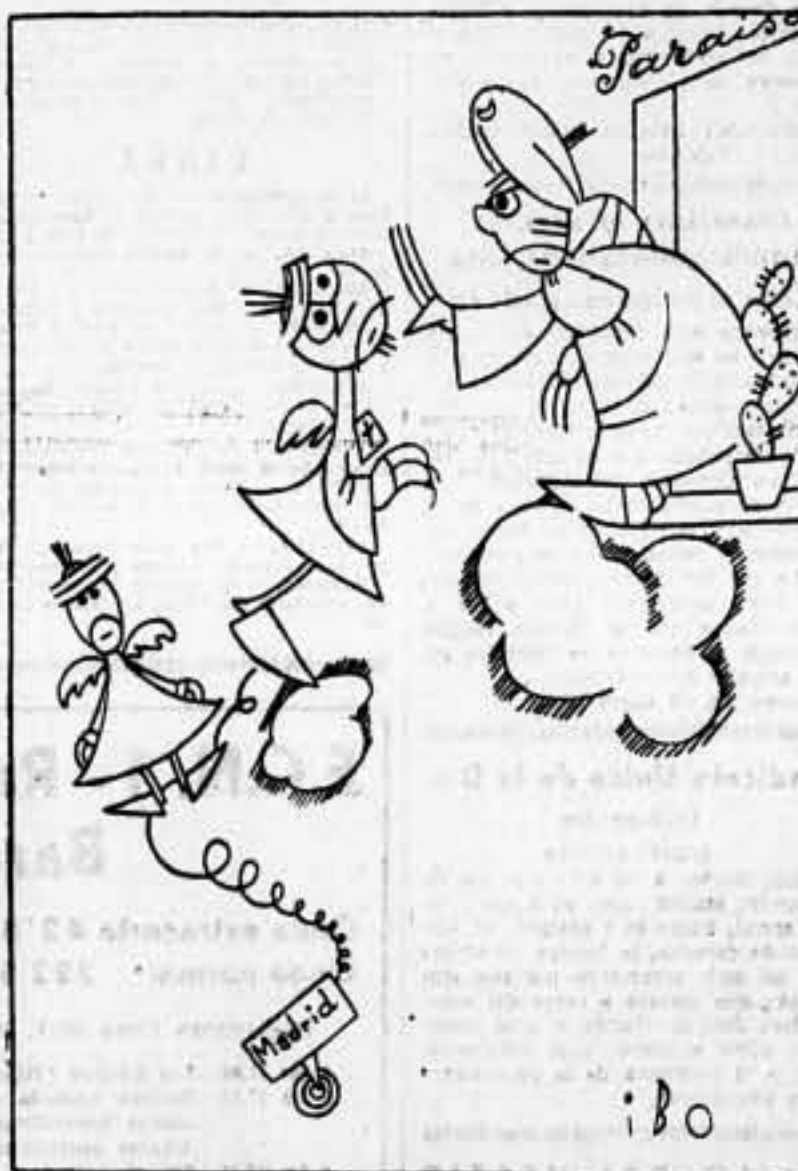
Mahoma.— ¡Idos a otra parte, porque aquí ya no hay sitio!

En otro párrafo se dice: «La muerte no ha sido con nosotros, porque la muerte de Sanjurjo lo truncó todo. Aunque Sanjurjo no había inventado la pólvora, manejado por el jesuita Herrera, que iba a lo suyo, es el caso que Sanjurjo era el jefe indiscutible del movimiento armado en España y en el extranjero, y que, de vivir, la victoria hubiera sido cosa de un par de semanas. Le sustituyó Franco, porque así lo quiso el jesuita Herrera, y desde la hora aquella las cosas no fueron como debieron ir».