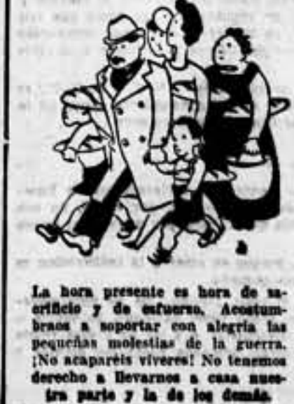
La hora presente es hora de sacrificio y de esfuerzo. Acostumbren a soportar con alegría las pequeñas molestias de la guerra. ¡No os apatañéis vivos! No tenemos derecho a hervarnos a casa nuestra parte y la de los demás.