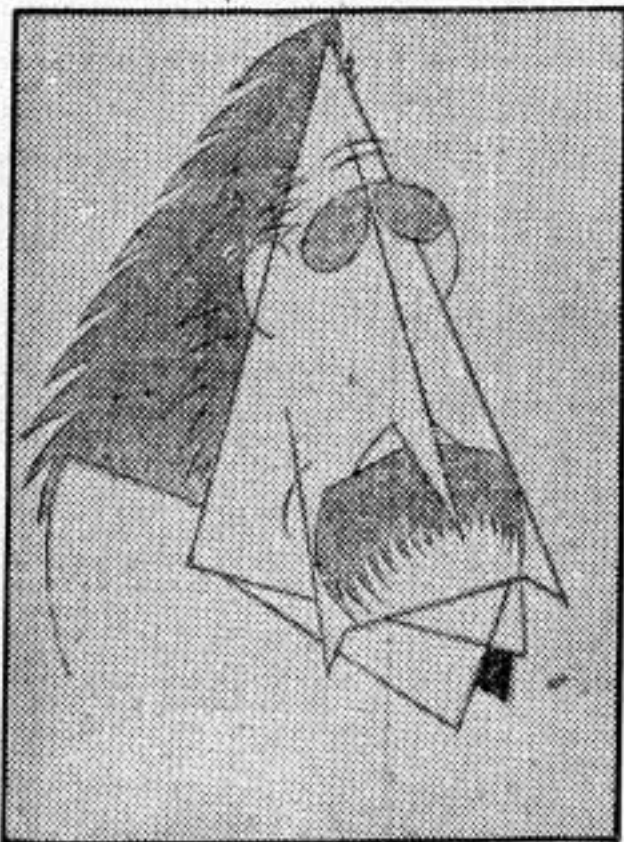
Leon Blum, el socialista millonario que dirige los destinos de Francia, cuyo designio democrático ha frustrado con su política oportunista. Falta ahora que se deje invadir el imperio colonial de Marruecos por los alemanes para que acabe su obra como los políticos de la España del 14 de abril. Sus pasos serán sinceros, pero tienen todas las muestras de la traición.