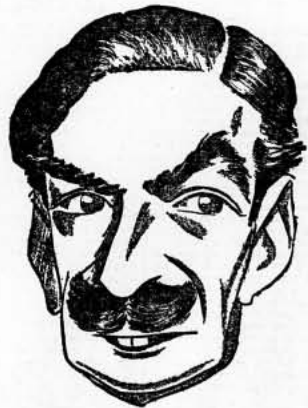
Mister Eden, figura mediocre de la Inglaterra conservadora. Autor de todas las fórmulas que perdieron a Abisinia y que entorpecen la Revolución de España. Puesto en el trance de optar, se quedaría con una España fascista, mejor que con una España obrerista. Su fingida amistad a España, puede ser nuestra ruina.

¡España es un pueblo hambriento de justicia, que lucha contra el imperialismo fascista y por su sagrada independencia. Y contra nuestra entereza, contra nuestro combativo tesón, no podrá la potencia criminal del fascismo. Ni decaemos ante la vergonzosa actitud de las democracias, actitud que se resume en una frase: ¡traición!