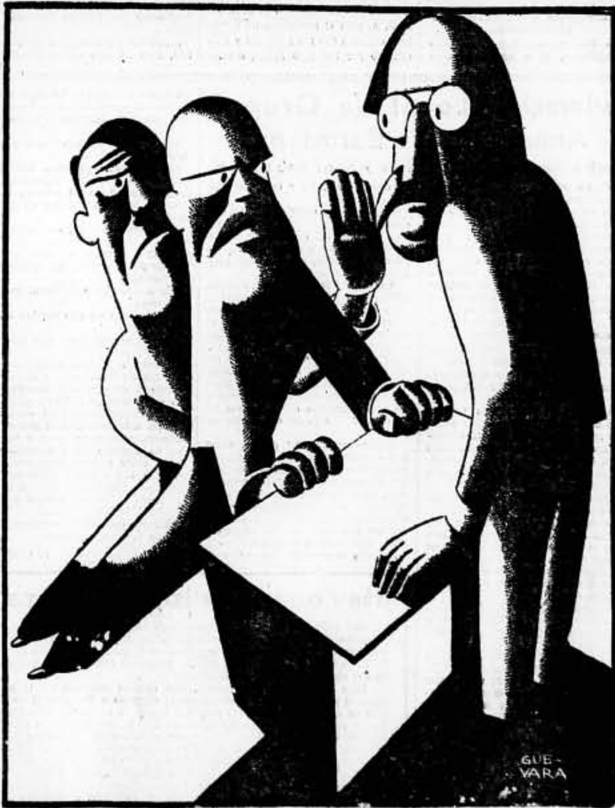
Hitler y Mussolini. — Y así, como siempre, agitando...