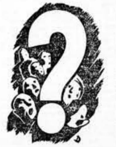
An'fascista de la retaguardia. ¿Qué prefieres? ¿No privarte de nada...