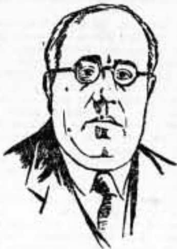
Don Manuel Azaña, presidente del Consejo de ministros y ministro de la Guerra, cuando los sucesos de Casas Viejas tuvieron lugar.