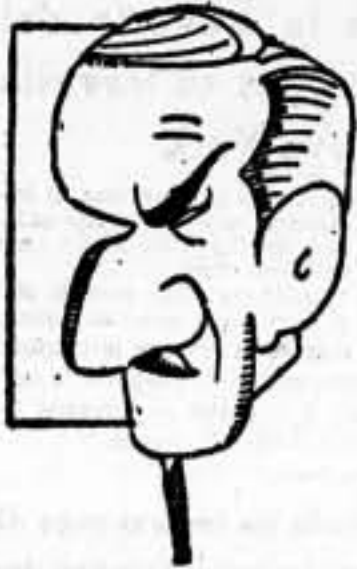
Eden en el dominio de la vida internacional y, como consecuencia, aborda la cuestión de España de manera clara y resuelta.

El secretario de Negocios Extranjeros del Gobierno inglés, Eden, ha pronunciado, en la Cámara inglesa, un interesantísimo discurso, exponiendo, ante su país, el panorama que ofrece la política internacional, en relación con Inglaterra. Fue el tema principal de su disertación, la cuestión española, que ha pasado a ser la máxima preocupación de todos los Gobiernos de Europa. No podemos, esta vez, tachar sus palabras de poco claras; contra la costumbre, ha expuesto con sinceridad la situación.