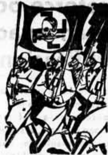
Los sembradores de la muerte

Desde que comenzó la ofensiva en el frente de Marbella y Estepona, no se ha visto ningún buque de guerra insurrecto en el Estrecho. — Fabra.