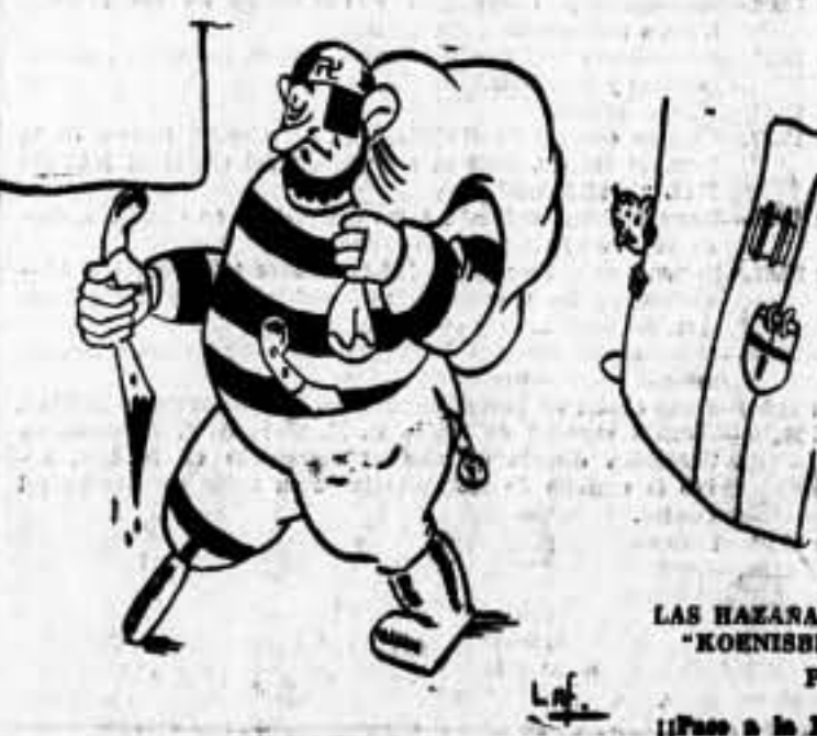
LAS HAZARAS DEL "KOENISBERG", Por LAP.