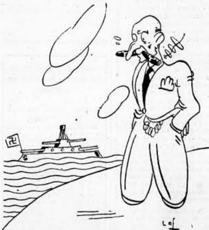
March. — Pero, ¿será posible que estos alemanes sean mayores piratas que yo?