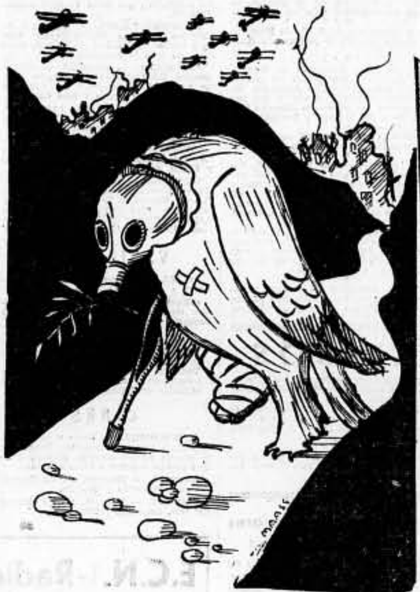
—¡Pobre de mí, cómo me han puesto!...