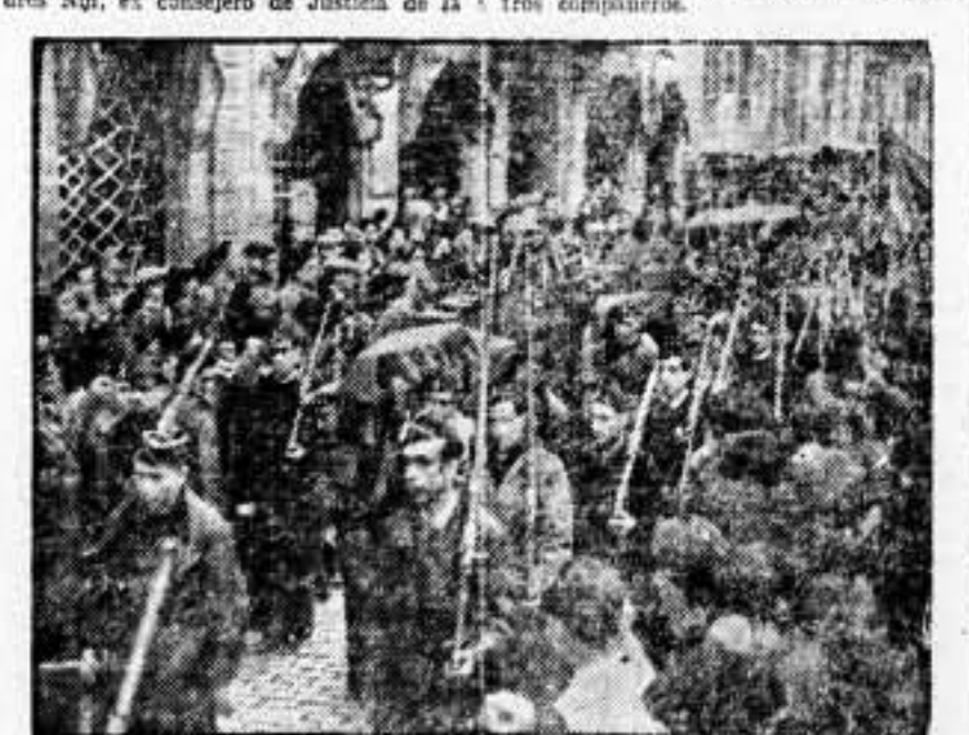
Entierro de los camaradas de Patrullas de Control, muertos en La Fatarella

El personal de SOLIDARIDAD OBRERA, Administración, Redacción y talleres, se asoció al duelo por la pérdida de nuestros compañeros.