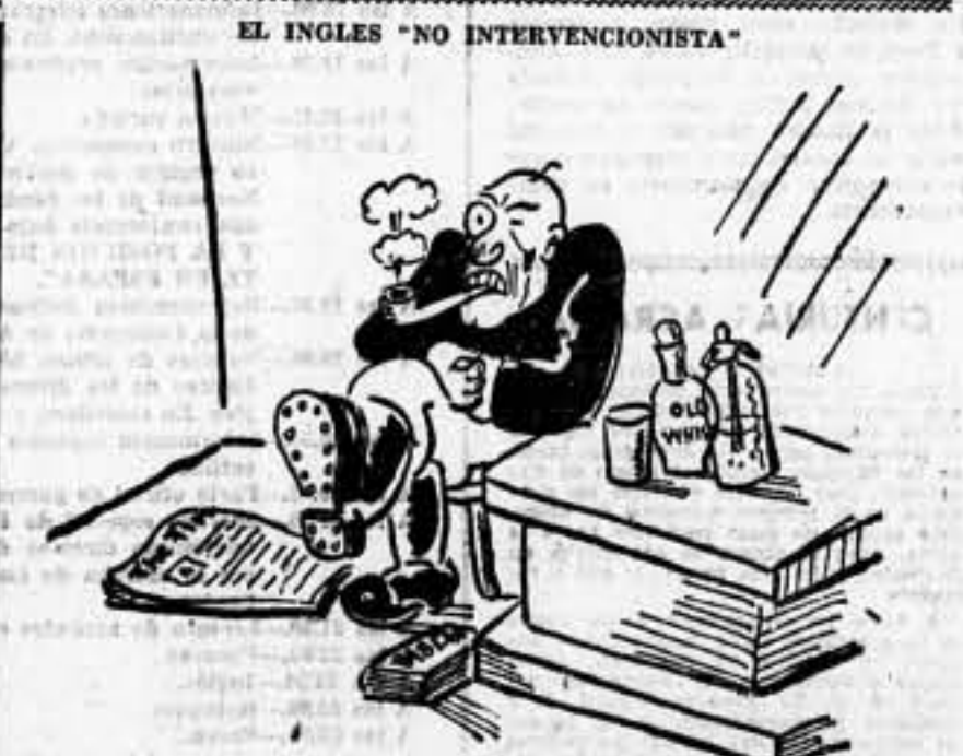
El no fallándome whisky-soda, aunque triunfe fascio, ¡y a mí no preokuparme de nada...

¡Y tienen razón! Cuánto mejor es dejarlos que nazcan y esperarlos con el aeroplano a la salida de las escuelas. Así, por lo menos, se salva a España.