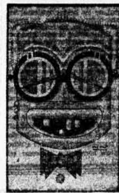
MANUEL AZAÑA, enemigo mortal de Lerroux. Hoy, presidente de la República española

Al terminar Azaña su despidado ataque al nuevo Gobierno, su derrota era cosa inevitable. Lerroux, comprendiendo que su vida política dependía de cuanto pudiera ocurrir en aquel momento, trazó un plan para evitar que surgiera la votación, ade-