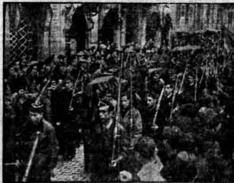
Entierro de los camaradas de Patrullas de Control, muertos en Fatarella