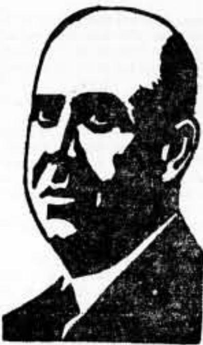
Gil Robles, el "jefazo"