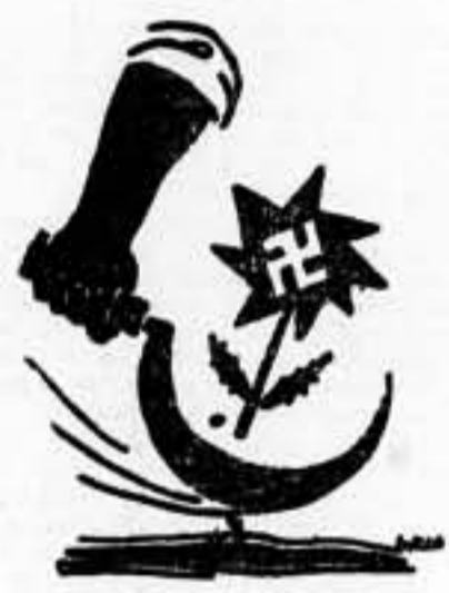
LA MALA HIERBA...

Están a la orden del día los mítines y las conferencias. Por cierto que en algunos de estos actos se pueden aprender cosas muy interesantes. Dirigir la palabra al pueblo para señalar trayectorias claras y concisas, no solamente es un deber, sino una obligación ineludible. Las conferencias que hasta el presente vienen celebrándose todos los domingos en el cine Coliseum, son todas ellas tan instructivas y tan interesantes que, por lo menos el pueblo, se percata debidamente de la capacidad constructiva de los hombres que forman en las filas de la Confederación Nacional del Trabajo. En cambio, y sin espíritu de sectarismo alguno, se realizan otros diversos actos que llevan el sello de la discordia y no aportan sus exponentes solución alguna para la guerra, ni para la Revolución. Se llenan la boca pidiendo mando único, disciplina y despotricando contra los avances del proletariado en el terreno económico. Buscan el aplauso de la galería con palabras encubiertas y deftendos apetitos inconfesables. Menos mal que solamente les escuchan todos aquellos que sienten un odio ancestral contra los trabajadores, respaldados con un carnet sindical en el bolsillo. Se despotrican contra las colectivizaciones y contra los órganos genuinos de la clase trabajadora, y se dicen una serie de sandeces que reflejan perfectamente la posición de los revolucionarios de boquilla.