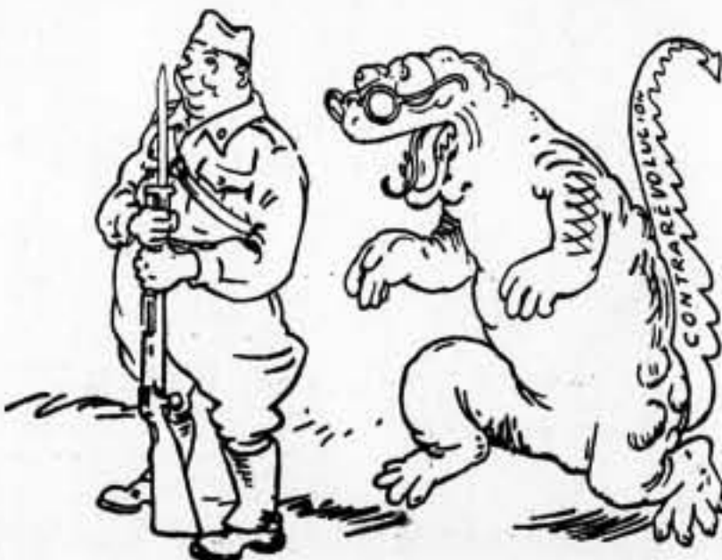
Cuidado milicano el peligro que acecha por la retaguardia