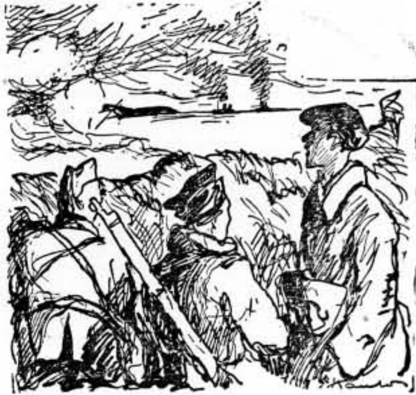
—El Comité de no intervención... como su nombre indica, no interviene para nada.