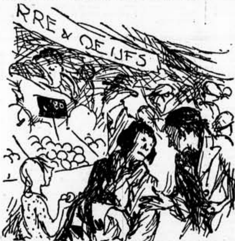
—¿Cómo cree usted que se podría detener el alza de los precios? —Muy sencillo. Deteniendo antes a los especuladores.

SOBRE PORT-BOU HAN VOLADO AVIONES FASCISTAS