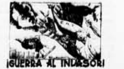
GUERRA AL INTASORI

Londres, 15.—Al "Daily Herald" le comunica su corresponsal en Gibraltar que, según noticias fidedignas que obran en su poder, el ejército italiano que se encuentra en España al servicio de Franco, se halla constituido por unos 50.000 hombres, esperando la llegada de otros 30.000 en el curso del actual mes de febrero, con lo que se llegará a la cifra de 80.000. Que son los comandantes italianos que acompañaron a Goering en el curso de sus entrevistas con Mussolini. — Cosmos.