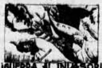
GUERRA AL INDIOSO

Puede darse por seguro que el ministro de Negocios Extranjeros, señor Tatarescu, en persona, contestará a los interpeladores. — Fabra.