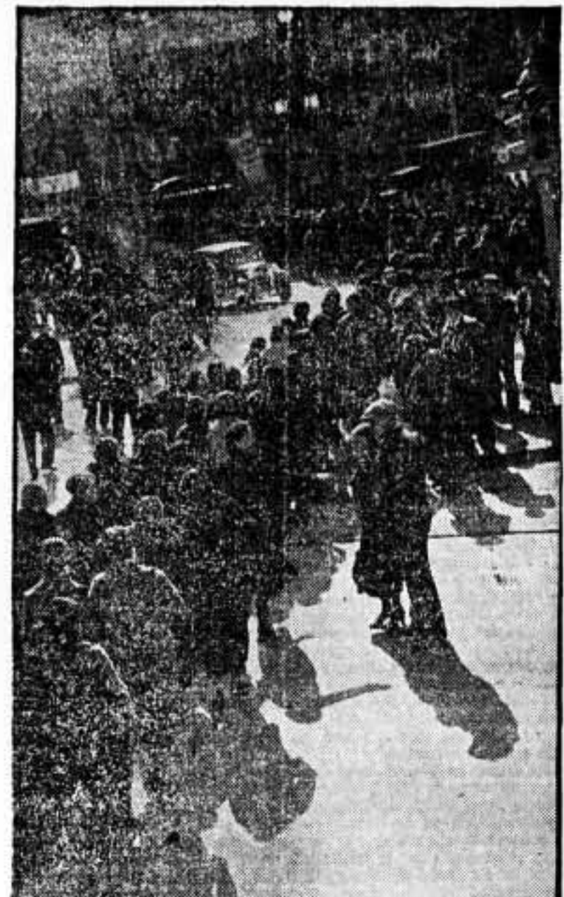
Un aspecto de la manifestación de mujeres que tuvo lugar ayer para protestar ante los consulados extranjeros del asesinato de mujeres y niños perpetrados por los buques fascistas en sus agresiones contra la población civil.

JUVENTUDES LIBERTARIAS DEL SINDICATO DE FUNCIONARIOS MUNICIPALES Se convoca a todos los asociados a estas Juventudes, para asuntos de suma importancia, en Rambla de Cataluña, 10, 1.º, 1.º.