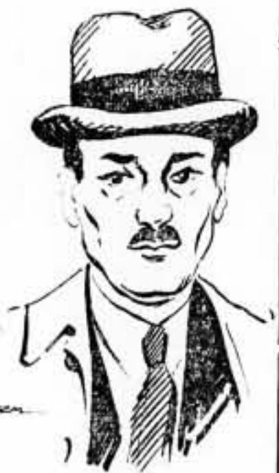
EL MAYOR ATTLEE

Ha hecho lo que se llama "nadar y guardar la ropa".