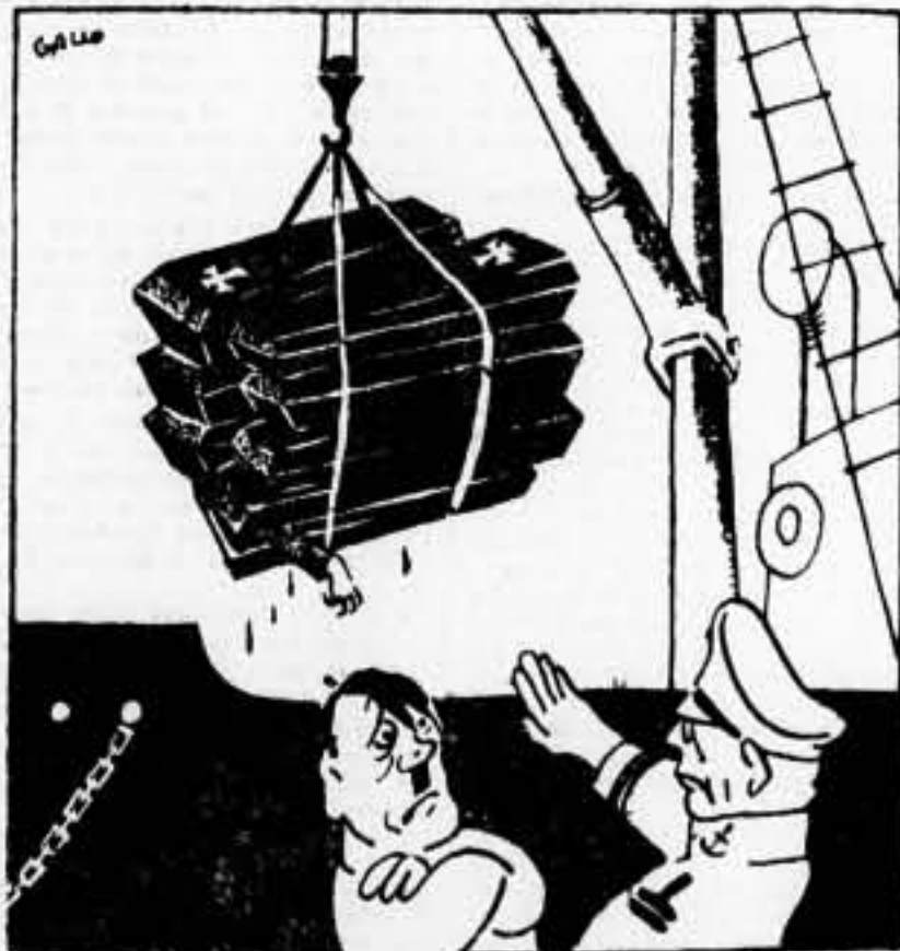
—Y el plomo español, producto de nuestra captiva, ¿dónde lo traéis? —Ahí viene, señor, dentro de nuestros cadáveres.

Londres, 5. — En el curso de una reunión política, el diputado conservador Amery, ex ministro de Colonias, ha declarado: «Queremos la paz y estamos dispuestos a encontrar los medios de resolver las dificultades con Alemania, al menos en cuanto estas dificultades no son resultado de la política de la misma Alemania. Pero la política de concesiones no fué nunca una política de paz.» Amery criticó duramente las reivindicaciones coloniales alemanas, a las que rehusó reconocer otro fundamento que las consideraciones de prestigio. Agregó: Estoy seguro que los alemanes son el último pueblo del Mundo con el cual nuestras relaciones pueden mejorarse con concesiones que serían una prueba de debilidad.»