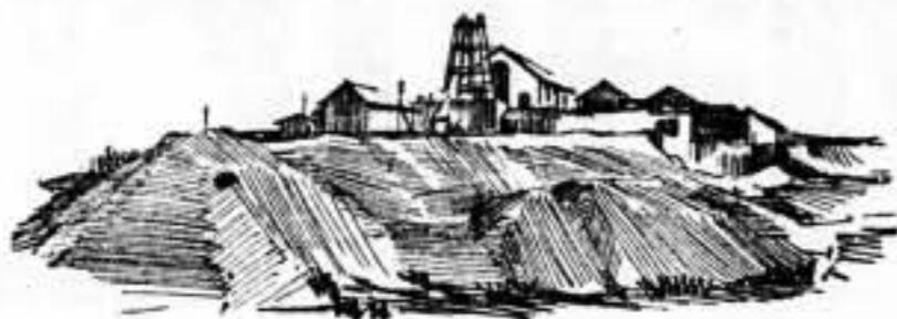
Mina «Renania», de Bellmunt de Clurana (Priorato), que, no obstante disponer de moderna maquinaria completa, la burguesía tenía sin explotar, por la baja de precio del plomo

Como ocurría siempre en el régimen burgués de trabajo, los oficios más penosos, los que más agotan al hombre, eran los menos remunerados. El de minero no se escapaba a esta regla general. Las mujeres que trabajan en el escogido de minerales, separando la roca del plomo, para que éste lleve el mínimo de materias extrañas, cobraban dos pesetas con cincuenta céntimos al día. Ahora perciben seis pesetas. Los martilleros tenían un jornal de 750 pesetas, ampliado ahora a 1150 pesetas.