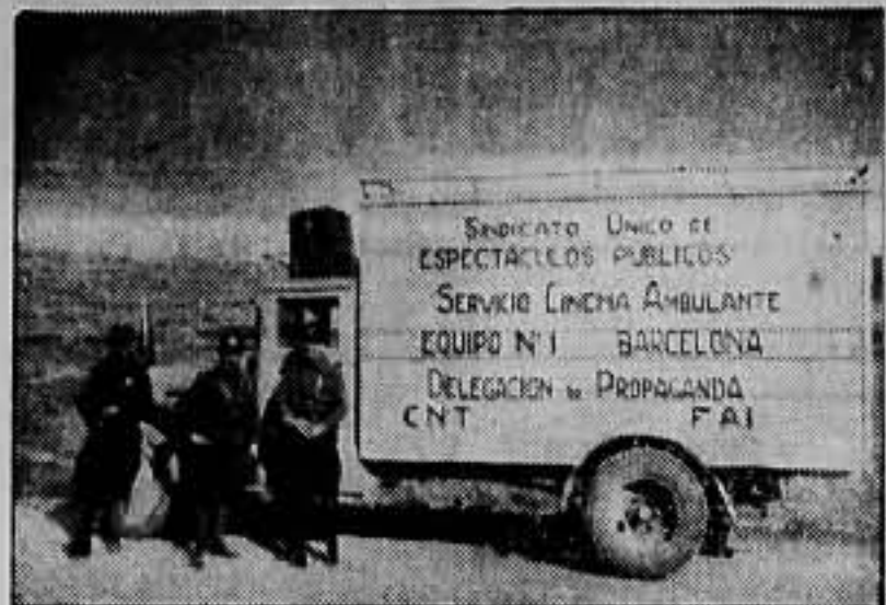
Un cinematógrafo ambulante del Sindicato Unico de Espectáculos Públicos que actúa por los pueblos y frentes de Aragón

papel en el Báltico. Esta cantidad, o gran parte de ella, quedaría en España.