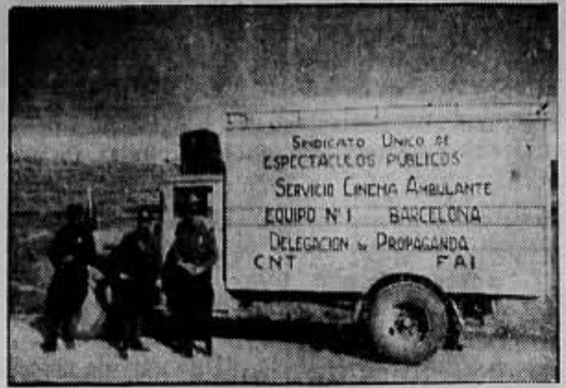
Un cinematógrafo ambulante del Sindicato Unico de Espectáculos Públicos que actúa por los pueblos y frentes de Aragón

—Podríamos obtener asimismo con el esparto sin blanquear la pasta "kraft", que es la que da una de las mejores calidades de papel: la que se emplea para los envases del cemento, y en una palabra, se lograrían los resultados más sorprendentes. Cuanto queda dicho no es consecuencia de una teoría aislada porque hemos hecho pruebas en grande y con feliz éxito. Sólo faltan elementos para poder emprender la explotación en gran escala y abastecer a toda España de la pasta necesaria para nuestro consumo nacional.