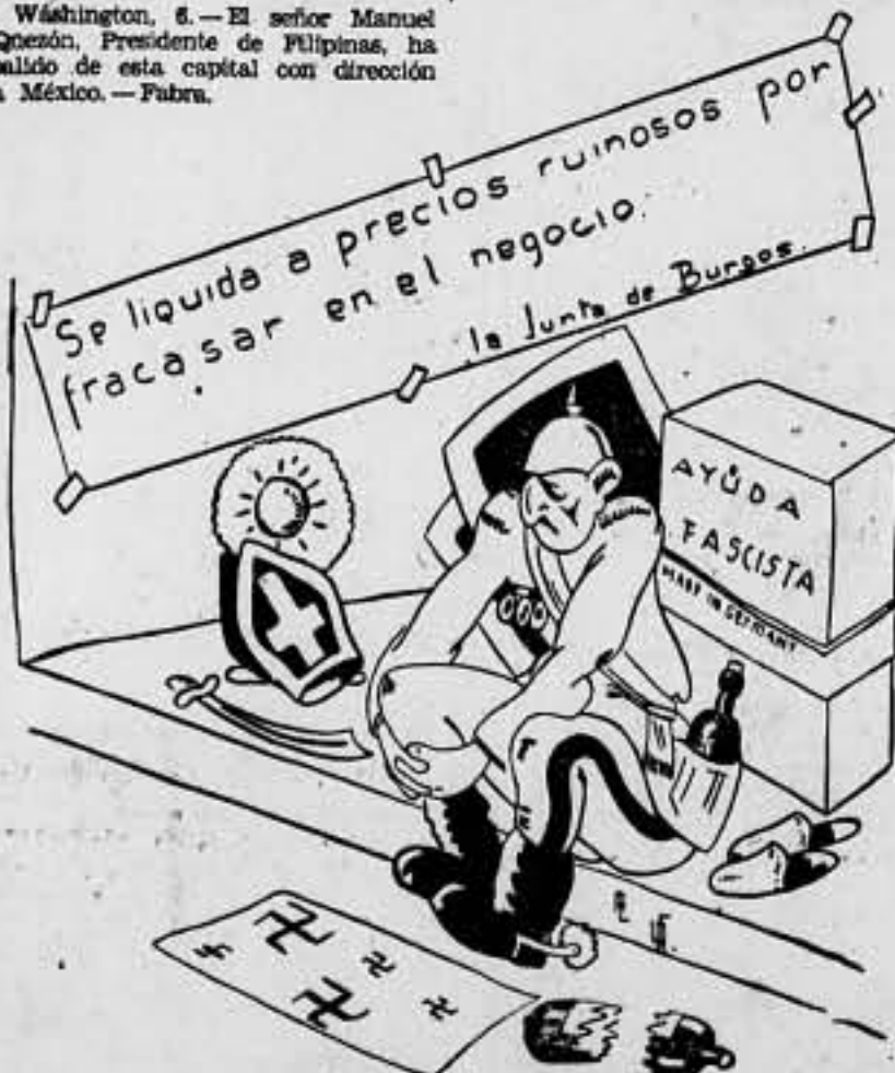
LO QUE MUY PRONTO VEREMOS

Washington, 6. — El señor Manuel Quezón, Presidente de Filipinas, ha salido de esta capital con dirección a México. — Fabra.