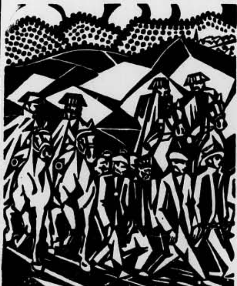
De nuestra voluntad y esfuerzo, depende el que los oprobiosos tiempos que evoca este grabado, no puedan retornar

Encontrar la homogeneidad de las jornadas de trabajo, y, por consecuencia, el bienestar de los trabajadores; dar con una ligazón orgánica perfecta de la industria, de la agricultura y las entidades sindicales; aunar el ritmo del sector trabajo con la marcha de los organismos rectores; borrar desigualdades con el salario familiar y adentrarse, en suma, en un régimen de equidad y justicia, son cosas que bien valen la pena de un instante de lucidez o de buena fe que permita llevar a efecto esa socialización hacia la que marchamos, quieran o no sus detractores.