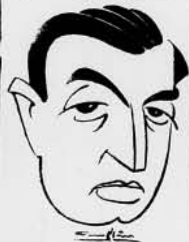
GABRIEL FRANCO, ex eminencia gris

Otro personaje. Republicano también. Lo presentaron como eminencia de las finanzas. Fué ministro de Hacienda. Y pasó a la Historia, camino de la frontera francesa.