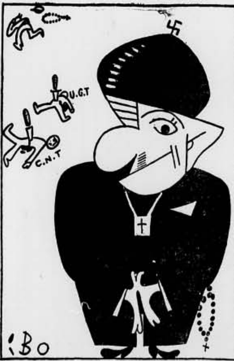
El «cañer» de la boina: —¡Vaya! Esto marcha sobre ruedas...