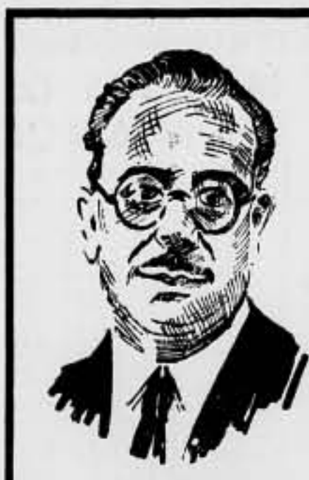
JUAN NEGRÍN Presidente del Consejo de Ministros

Orán, 17. — Han llegado a esta capital tres "autocars" conduciendo a 106 franceses y españoles que han sido puestos en libertad por los rebeldes, después de haberles retenido prisioneros desde fines de julio en que un hidroavión obligó al buque «Nuria» a fondear en Melilla. — Fabra.