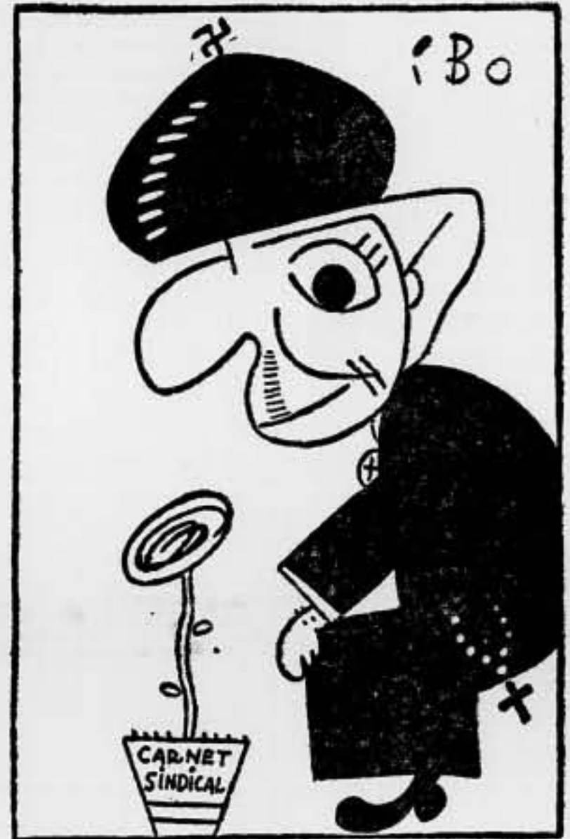
El "señor" de la boina: —Me pondré detrás del arbolito y pasaré desapercibido.