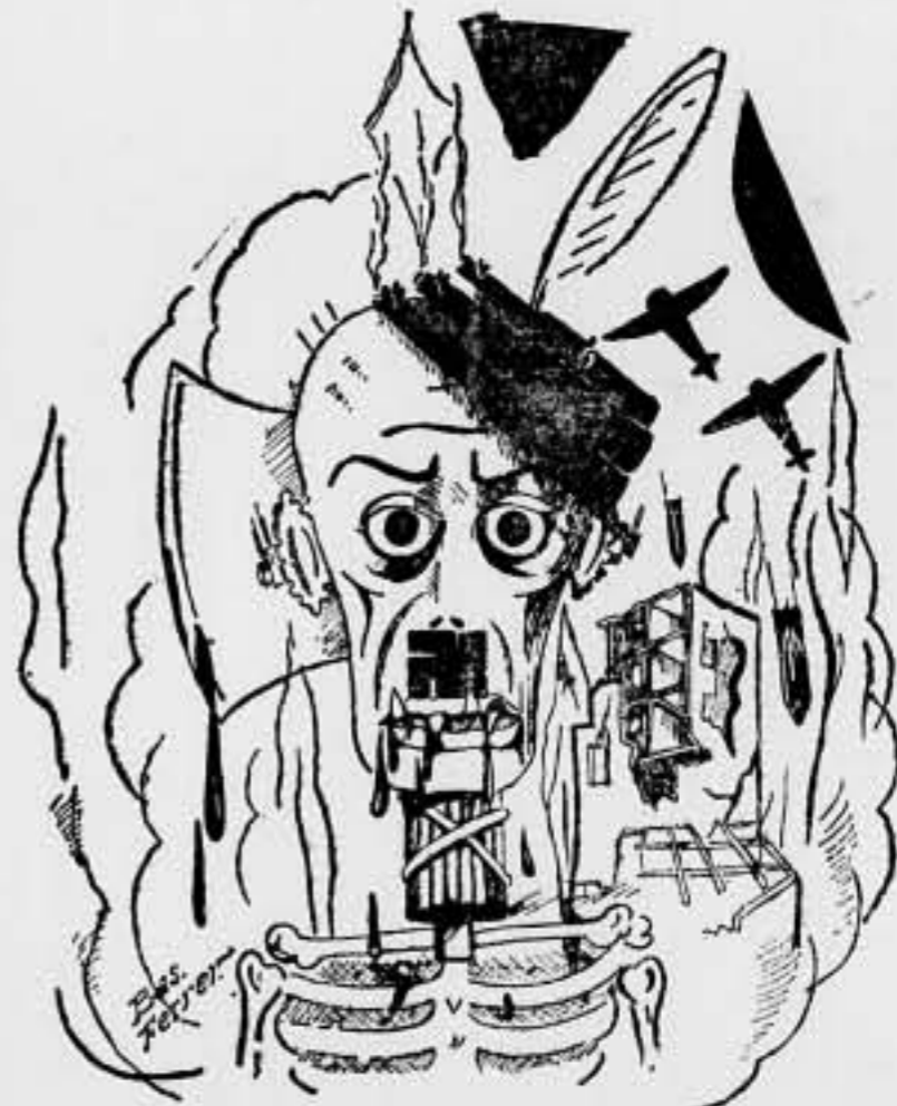
¿Hitler?... ¿Mussolini?... ¿La Muerte?... ¡FASCISMO!!

¡Qué vergüenza y qué cinismo! Curtet Jaques Ginebra, mayo, 37.