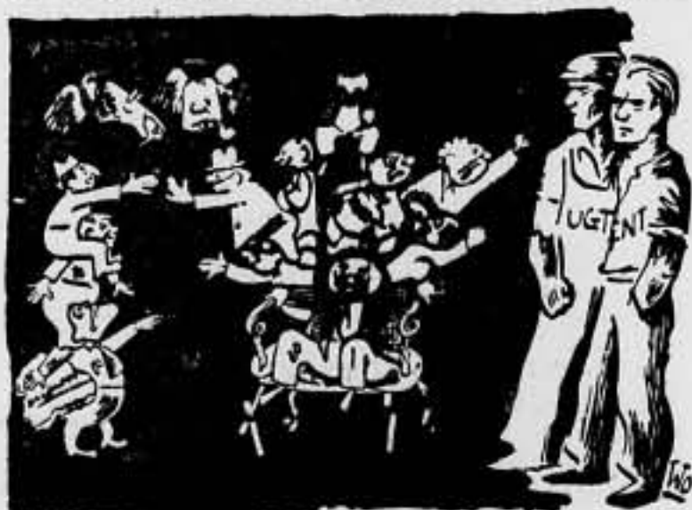
El nuevo Gobierno

Valencia, 18. — El Comité Nacional de la C. N. T., ha hecho pública la siguiente nota: «Constituido el Gabinete Negrin, sin nuestra participación, consecuentes con nuestra posición, no prestamos ninguna colaboración al mismo. En este momento, sólo nos cabe poner en conocimiento del proletariado encuadrado en la Confederación Nacional del Trabajo, que ahora más que nunca debe mantenerse atento a las consignas de los Comités responsables. Que nadie obre por su cuenta. ¡Sólo con homogeneidad en la acción haremos fracasar la contrarrevolución y lograremos que se frustre el propósito del «abrazo de Vergara»; ¡Camaradas! ¡Atentos a las consignas de los Comités responsables! ¡Que nadie se preste al juego de los provocadores! ¡Serenidad! ¡Firmeza y unidad! ¡Viva la alianza de las sindicales!» — Cosmos.