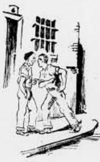
Hay que ayudar a los camaradas campesinos de las Colectividades. La obra de las Colectividades representa la plasmación de las ideas liberatrices del proletariado

1.ª Que ninguna persona se presente en esta antes de comunicarlo a este Consejo, porque nos hemos dado cuenta de que se ha presentado mucha gente improductiva. Ahora no es