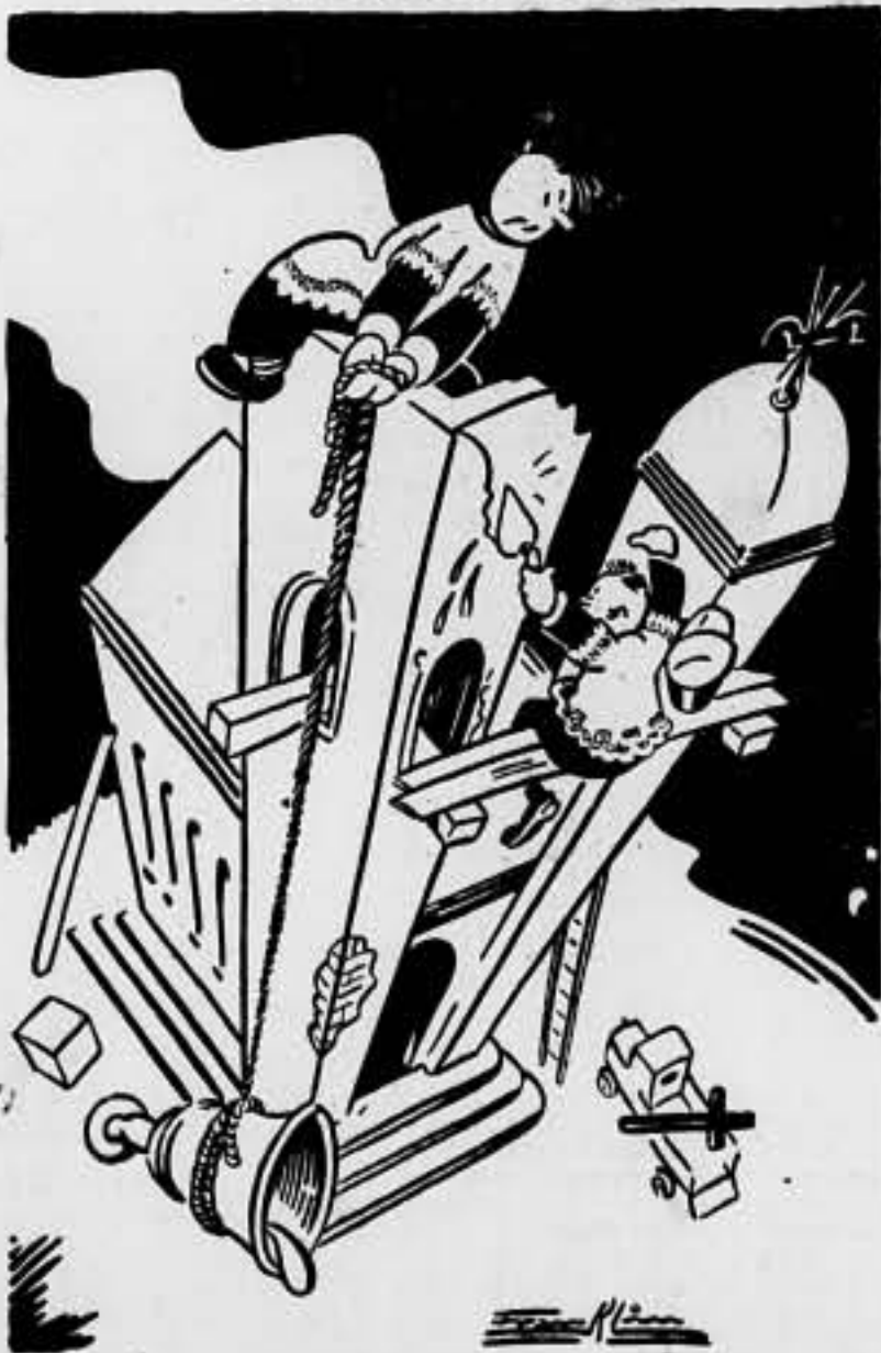
Preparando la nueva temporada