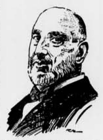
El gran juriconsulto Angel Ossorio y Gallardo, a quien se da como seguro embajador de España en París