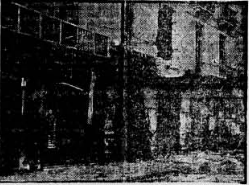
Los destrozos causados por la aviación alemana en el edificio de un Colegio de párvulos en la Via Durruti.