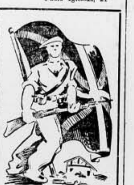
El Comité de Ayuda a Euzkadi, ante el gran número de peticiones para la celebración de festivales...

Comité de Ayuda a Euzkadi, Pablo Iglesias, 21