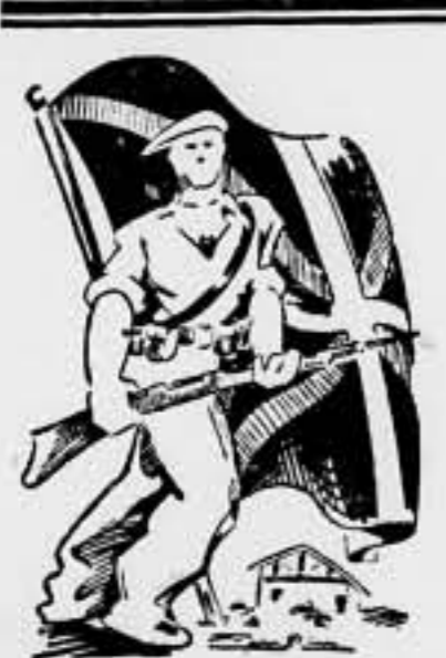
Trabajadores de Cataluña: Contribuid con vuestros donativos para ayudar a los luchadores de los frentes vascos, entregando los mismos al Comité de Ayuda a Euzkadi, Pablo Iglesias, 21, constituido el día 26 de abril de 1937

III El otro argumento nuestro, poderosamente convincente, es cambiar la faz del mapa de la guerra. Cuando hayamos reducido los dominios de Franco a la región al sur del Tajo nadie se atreverá a hablarnos de armisticio ni de mediación. Lo urgente es reconquistar el norte de España y reinstalar el Gobierno en Madrid. La llegada de nuestro Ejército ante Segovia, es ya un buen paso en esta dirección. Igualmente lo es el avance Tajo arriba, apuntando a Monreal. Junto a Madrid quedan unas espigas que hay que segar cuanto antes: la Ciudad Universitaria los cerros del Aguila y de Las Garabitas, y los falciosos del Jarana. Quitadas, Madrid, está libre. El Gobierno debe volver cuanto antes a él. En Euzkadi, los agresores, van de mal en peor. De la Sierra de Guadarrama les piden scorro angustiadamente. Y lo que Mola y Compañía se dirán: Pero, a nosotros, ¿quién nos socorre? La guerra ha cambiado de aspecto, y la política de la guerra, mixta. Alemania e Italia acaban de torpedear la arteria y secreta maniobra que, de acuerdo con amigos influentes en las potencias democráticas, nos habría conducido a una paz pactada y a una República moderada, burguesa y parlamentaria. Eso ya no puede ser. Ahora, todos unidos, a ganar la guerra. Después, a organizar la nueva España, tal como quieran los españoles. Gonzalo de Reparaz