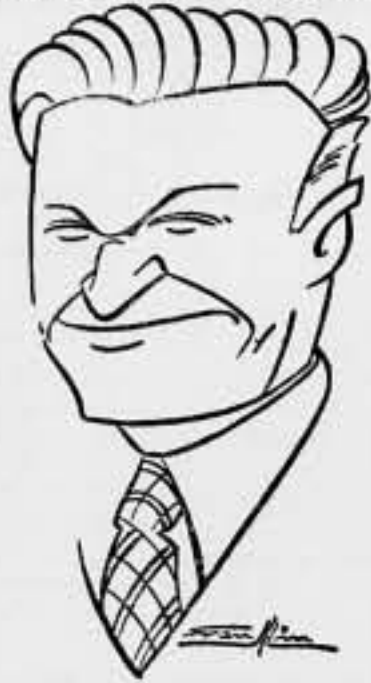
DEMETRIO AGUILERA MALTA

A pesar de su juventud, la personalidad literaria de Aguilera Malta, el