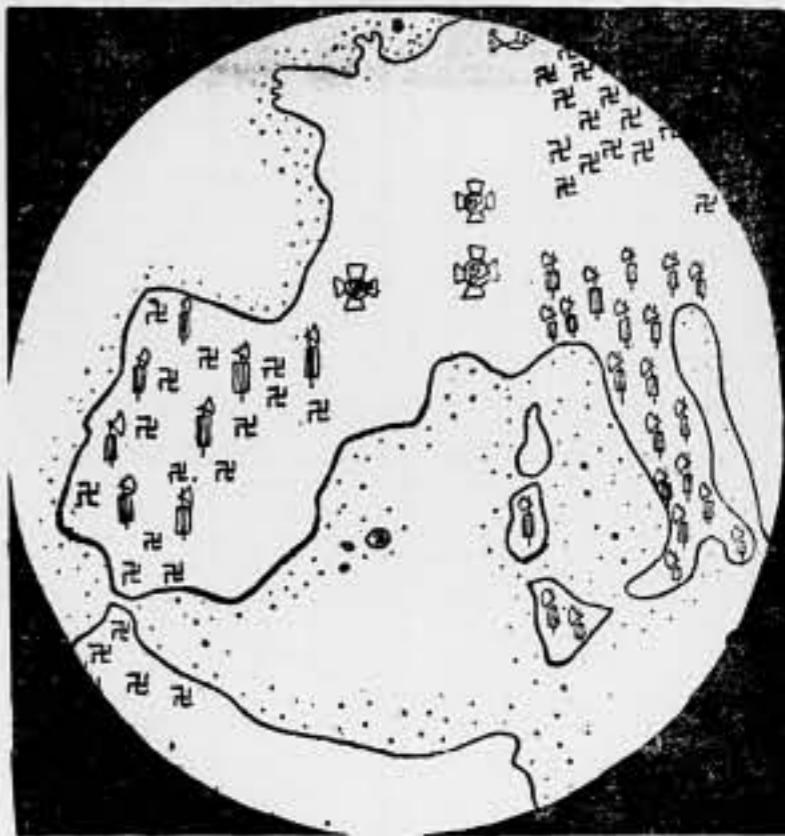
El microbio fasciohitlerius, visto al microscopio (Instituto bacteriológico de Léo Campion)