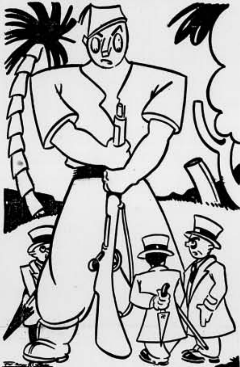
—Si. Venimos de París, para "luchar..." en la retaguardia.