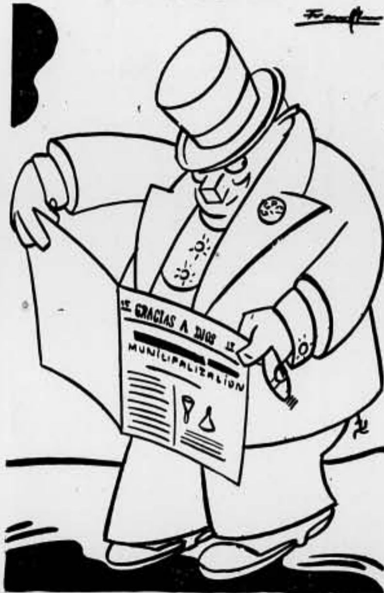
El "camarada" propietario: —¡Bendito sea el...! ¡Esto no va conmigo!

La retaguardia inactiva es impropia de estos momentos de peligro. Hombres, armas y dinero deben ponerse al servicio de la causa de la Libertad ANTES DE UN MES